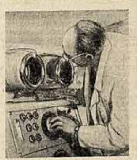
Кадр из фильма «Атомная энергия для мирных целей» при помощи которой лечат раковые опухоли.