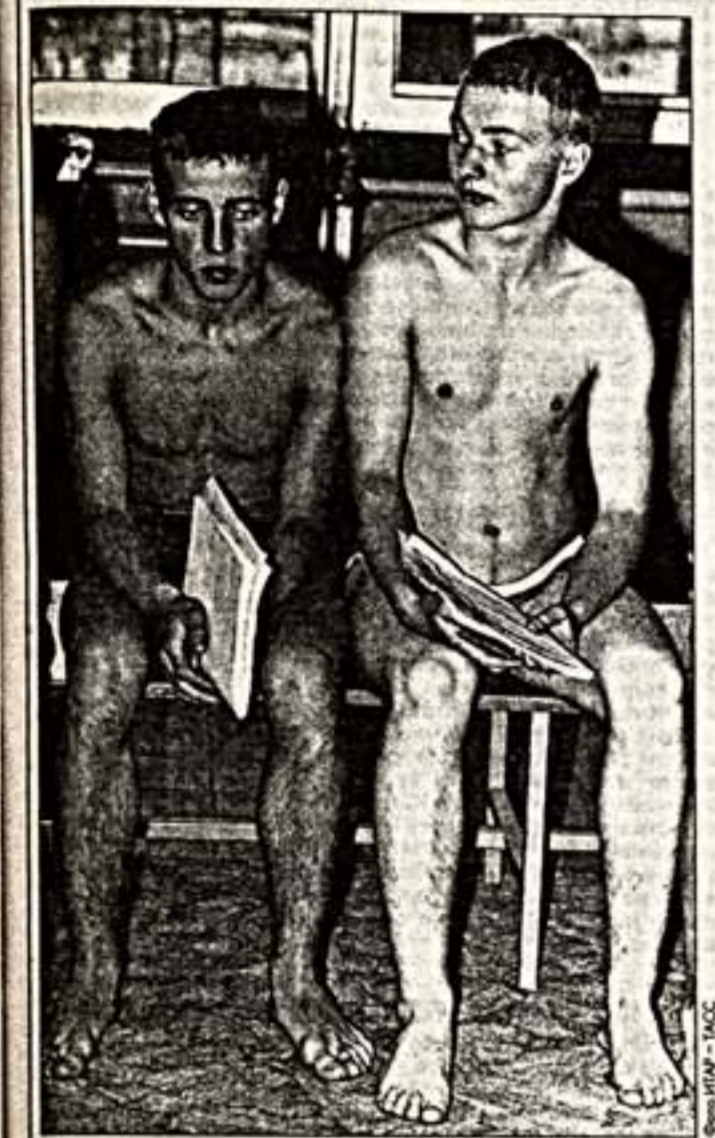
С другой — федеральный закон "О воинской обязанности и военной службе", подписанный на днях Президентом, согласно которому, в частности, в общеобразовательных школах может быть введена начальная военная подготовка.

Начало нынешнего весеннего призыва в Российскую армию было ознаменовано двумя противоречивыми событиями, вполне соответствующими тому неопределенному состоянию, в котором находятся наши Вооруженные силы.