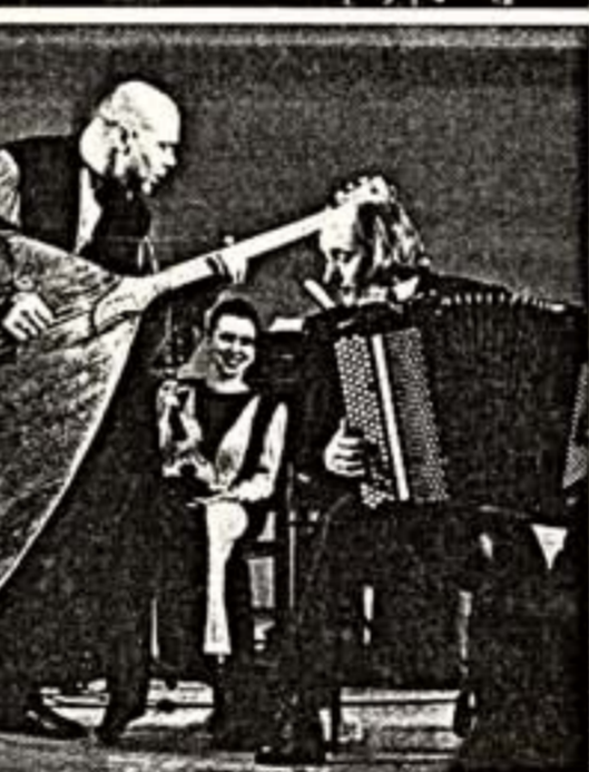
Кто в "Тереме" живет