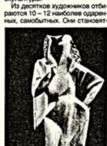
Слева: В.К.Королев. "Лана". Красное дерево. 1981 г. Справа: А.Костин. "Ночной блюз". Бронза, камень. 1993 г.