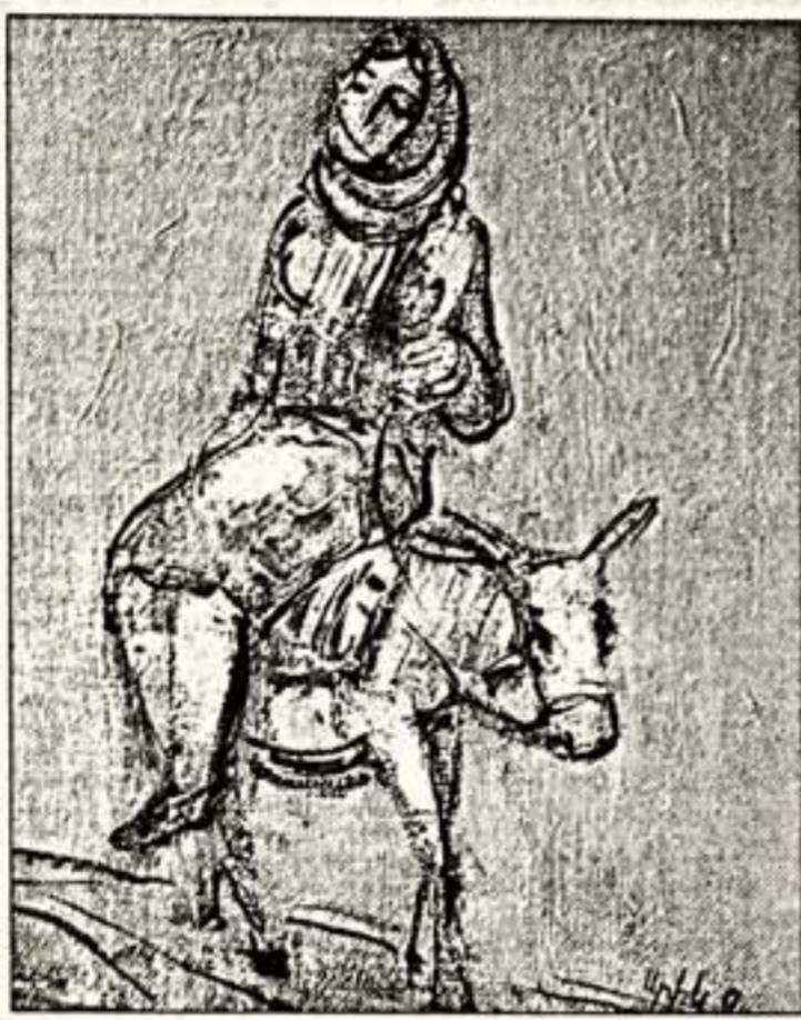
Ю. Григорян. "В тумане". 1993 г.