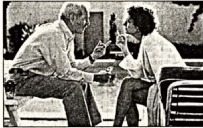
Кадр из фильма "Сумерки"