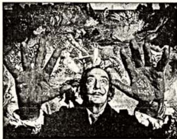
Сальвадор Дали в 1970 году на фоне своей картины "Ловля тунца"