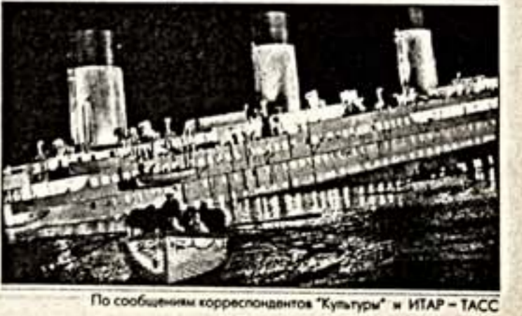
По сообщениям корреспондентов "Культуры" и ИТАР - ТАСС