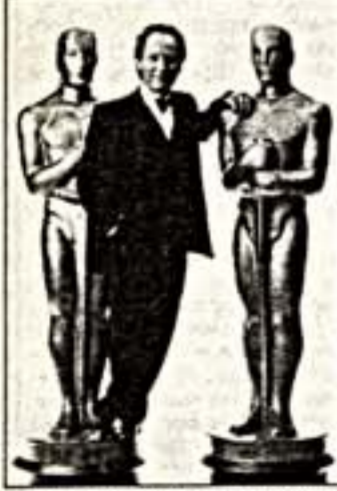
Слева: Во время подготовки к церемонии; справа: Известный комик Билли Кристал уже в шестой раз вел церемонию раздачи "Оскар"