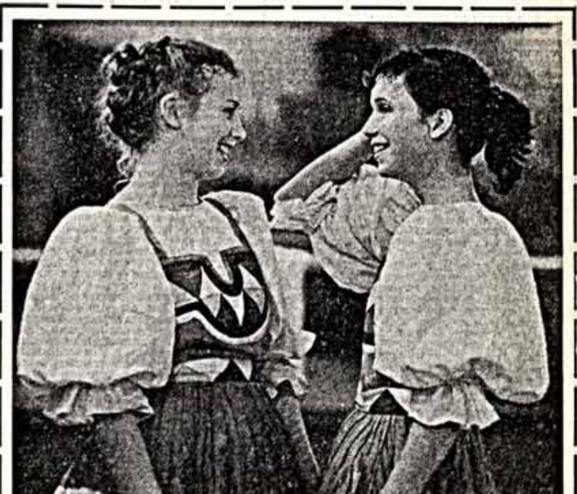
С творчеством народного коллектива — ансамбля танца профтехобразования «Славянка»...

А. БЕЛЯЕВ, редактор еженедельника «Талантливый» — район издательства «Уральский рабочий», Свердловск.