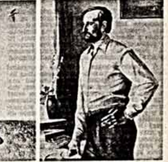
«Портрет писателя В. Комаринова»

как бы его биография, подлинный характер, и они становятся частными биографиями, характерами улиц, городов, страны.