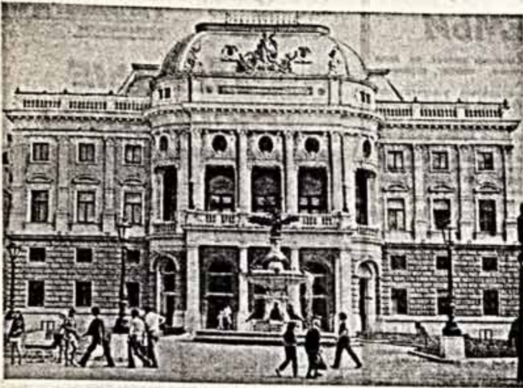
Как бы заманыва вытанутую площадь в центре Братиславы, посетив сегодня...