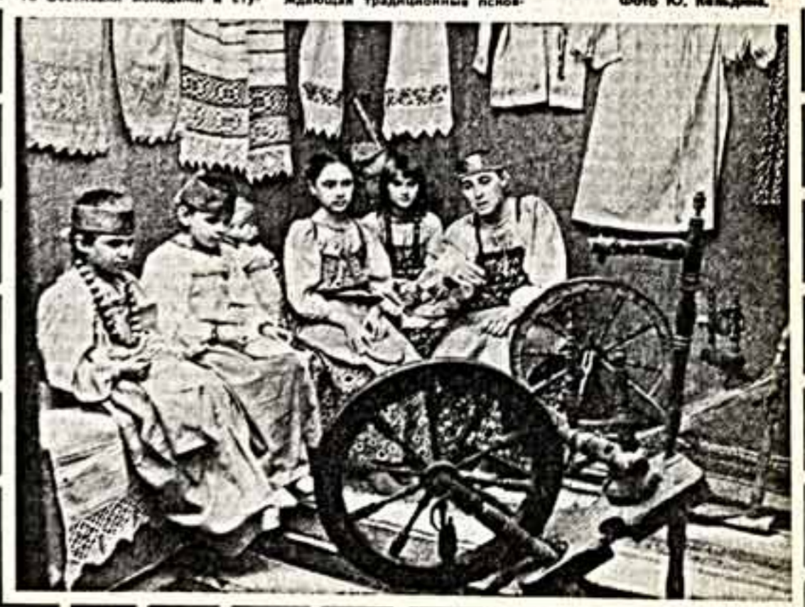
Студия «Мастерца», возрождающая традиционные песни и танцы в Москве.