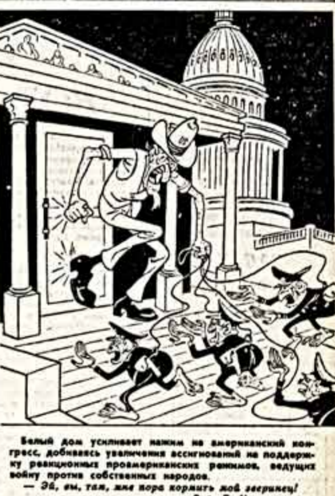
Белый дом усиливает нажим на американский конгресс...