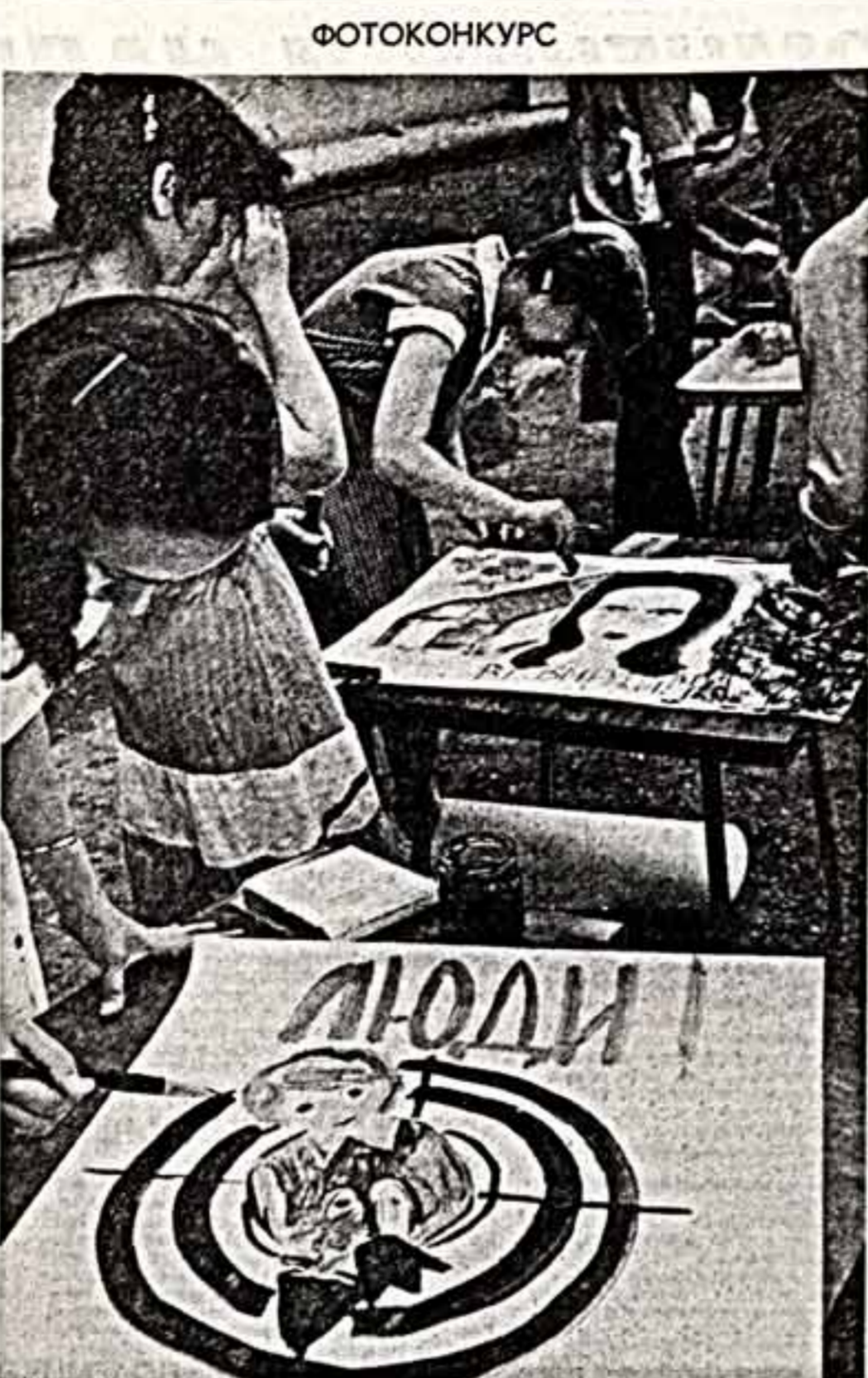
Почта каждый день приносит в редакцию читательские письма с пометкой «На фотоконкурс». Снимки образно рассказывают о деятельности советского искусства, о трудовых делах и заботах нашей страны, о буднях и праздниках, о семейном счастье и творческом досуге. Лучшие снимки по условиям конкурса, опубликованным 7 января 1986 года, будут премированы. Специальные премии для участников конкурса учредил харьковские производственно-технические объединения «ФЭД» в связи с 60-летием образования Коммунистической партии Украины и 100-летием со дня рождения А. С. Макаренки.