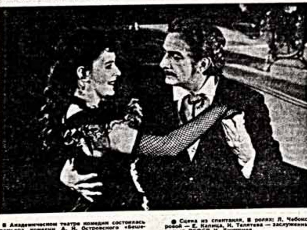
В Академическом театре комедии состоялась премьерная комедия А. М. Островского «Безымянные». Постановка спектакля режиссер В. Шаповал, оформил художник В. Викторов, музыка В. Федорова.