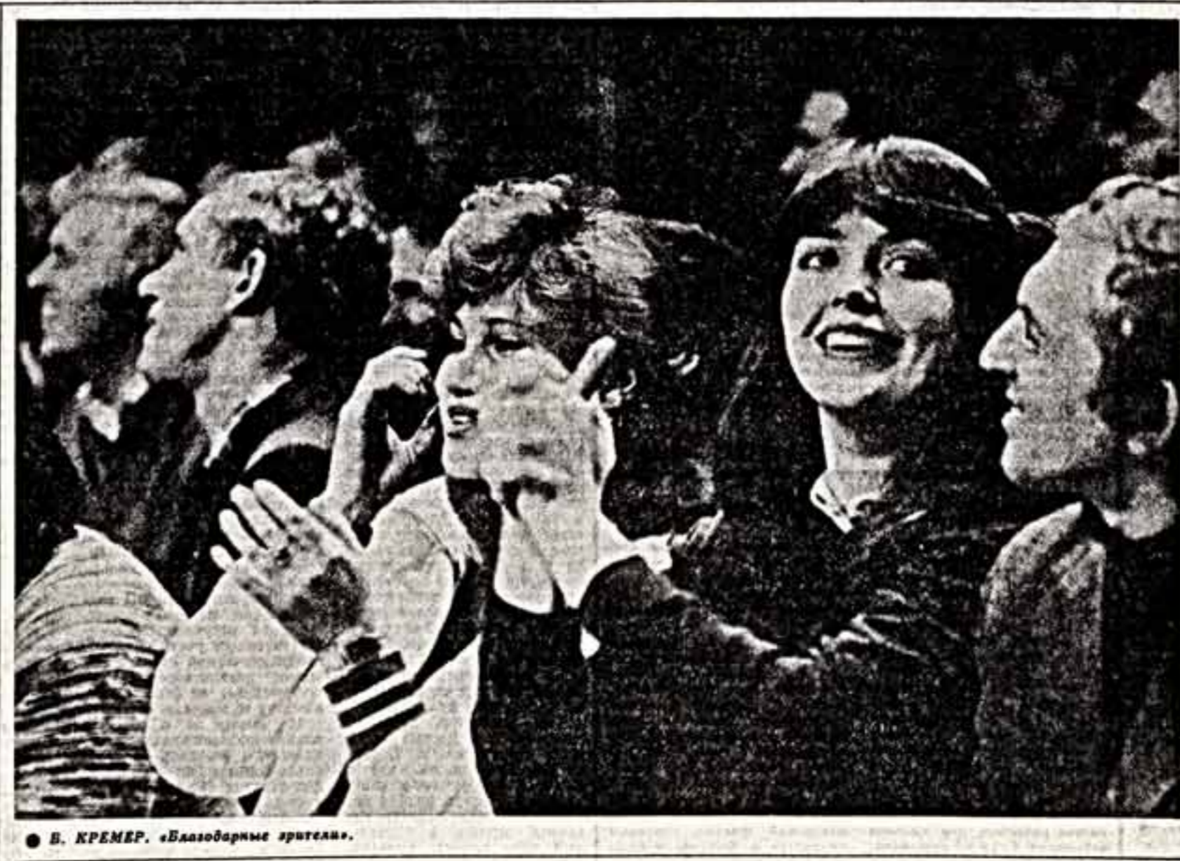
В. КРЕМЕР. «Благодарные зрители».

Я надеюсь, что «Советская культура» не будет устывать возвращаться к подобным вопросам.