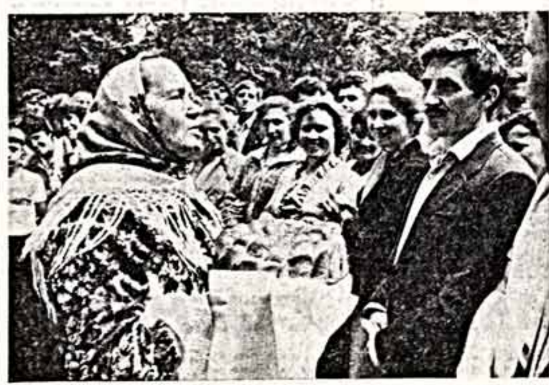
БЕРЕЖЛИВОСТЬ — ТРЕБОВАНИЕ ДНЯ