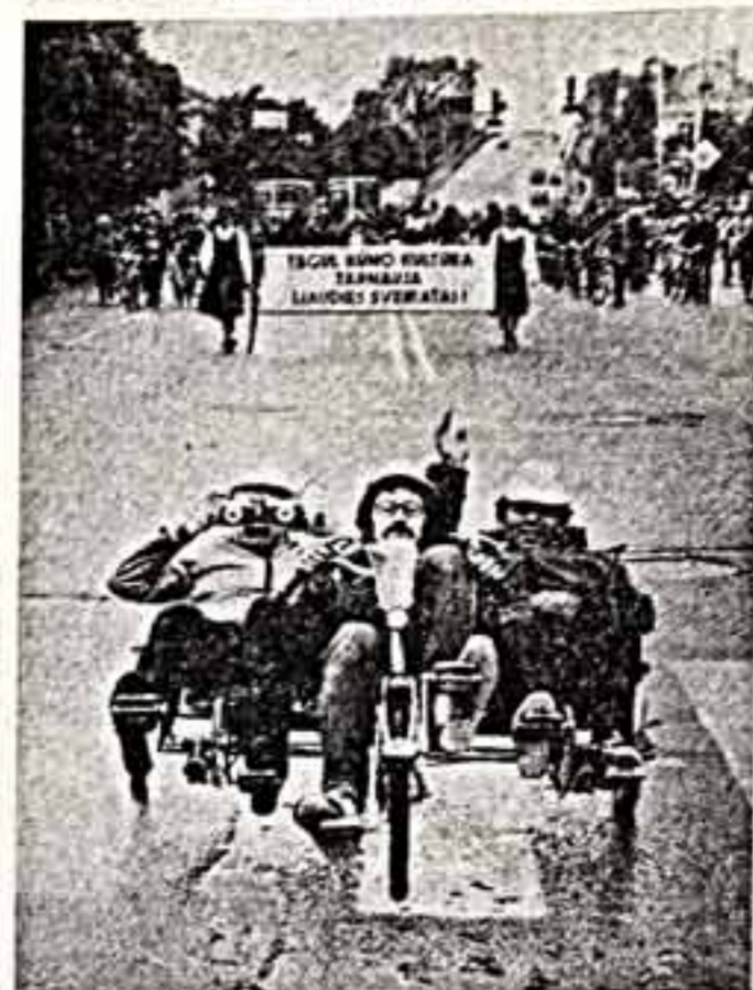
Такая вещь могла бы сделать каждый из нас.