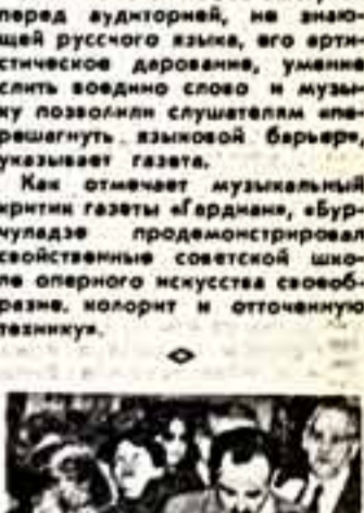
Материалы, посвященные Играм доброй воли