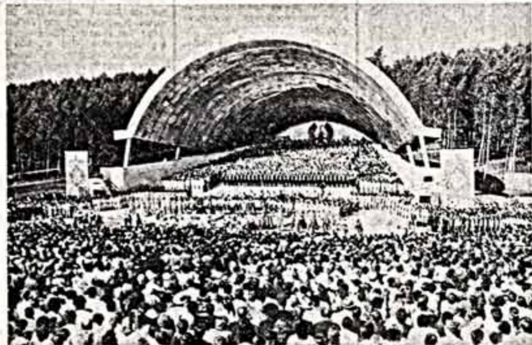
Песня над полем