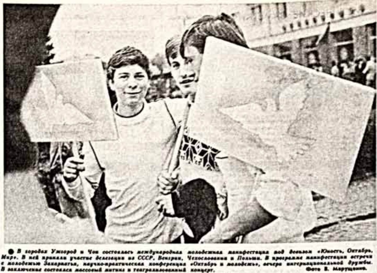
В городах Ужгород и Чен состоялась международная молодежная манифестация под лозунгом «Юность, Октябрь, Мир». В ней приняли участие делегации из СССР, Венгрии, Чехословакии и Польши. В программе манифестации встречи с молодежью Закарпатья, научно-практическая конференция «Октябрь и молодежь», вечера интернациональной дружбы.

Проектом второй очереди предусмотрено к концу года возвести манеж и зал площадью 2.700 квадратных метров. (Корр. ТАСС.) МАШИШ, Казахдунрянская область.