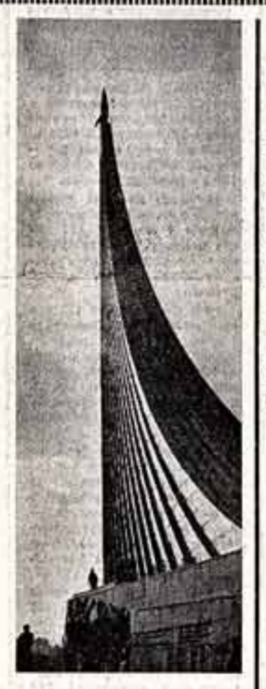
Н. МАЙДАНСКАЯ. МОСКВА.

Вдумаясь в путь советской космонавтики за минувшее время. Автоматическая станция «Луна-3» сфотографировала обратную, неизведанную сторону лунного светила. Спускаемый аппарат станции «Марс-3» впервые осуществил мягкую посадку на