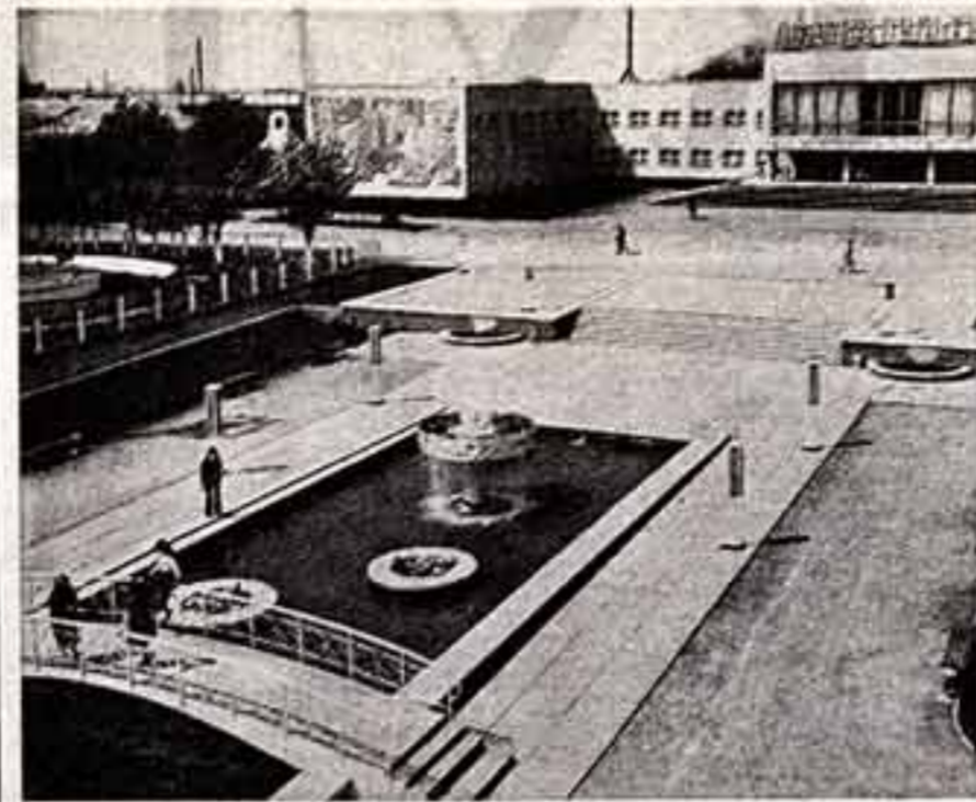
В центре села Чернобаево, центральной усадьбы ордена Ленина колхоза имени Кирова Белозерского района Херсонской области построил новый мост культуры. Новое здание Учебно-методического областного драматического театра имени С. М. Цвиллинга украсило площадь Революции в центре города. Представления могут идти одновременно в двух удобных зрительных залах.

Кроссворочные цифры 149,2 миллиона граждан СССР имеют высшее и среднее (полное и неполное) образование. В 1981/82 учебном году всем видным обучением было отмечено 100,5 миллиона человек. Число научных работников в нашей стране превышает 4 миллиона 405 тысяч человек. Расходы на науку в прошлом году составили более 22 миллиардов рублей. В СССР более 132 тысяч массовых библиотек и свыше 138 тысяч клубных учреждений. Книжный фонд массовых, научных, учебных, технических и других специальных библиотек превышает 5 миллиардов экземпляров. Тираж книг и брошюр в 1981 году составил в нашей стране 4 миллиарда 800 миллионов экземпляров, а разовой тираж газет, журналов и других периодических изданий — 3 миллиарда 227 миллионов экземпляров. В городах и селах страны действует более 151 тысяч киноустановок. Число посещений театров в прошлом году составило 121 миллион, а киносеансов — 4 миллиарда 217 миллионов. Отранной здоровья советских людей занято более 1 миллиона 28 тысяч врачей всех специальностей.