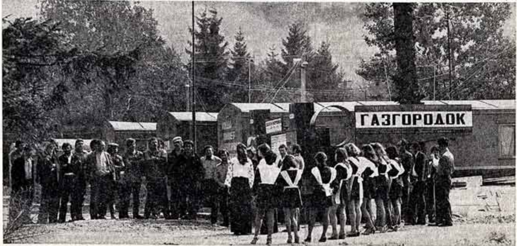
В гости к строителям газопровода Урало-Ужгород приехал с концертом ансамбля Ражжатовского дома культуры Павло-Фрэнковской

Столь серьезная программа работы, рассчитанная не на один год, а на много лет, стоит сегодня и перед нашим киноискусством.