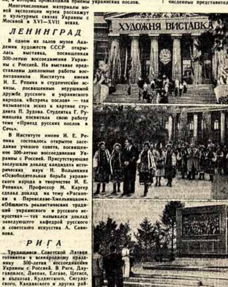
КИЕВ. На снимках: 1. У входа на Республиканскую выставку прикладного искусства, посвященную 300-летию воссоединения Украины с Россией; 2. Мастера искусства Москвы с участниками художественной самодеятельности Киевского государственного университета имени Т. Г. Шевченко; 3. Монумент, установленный у шоссе Киев — Переяслав-Хмельницкий. Надпись на монументе гласит: «Нарекать вместе с русским народом».