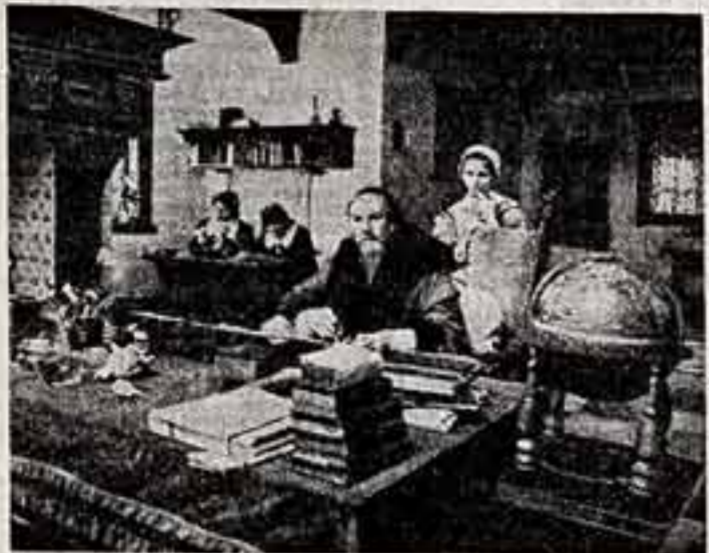
Со страниц романа о Коменском к миру между народами, обличая войну и агрессию.

В основу фильма лег строго документальный материал о судьбе этого выдающегося деятеля мировой науки и культуры.