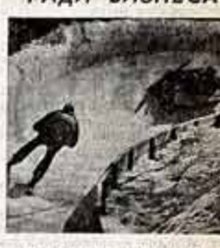
В фильмах прибыльной серии о Джеймсе Бонде, агенте с лицензией на убийство, мертвых не считют.