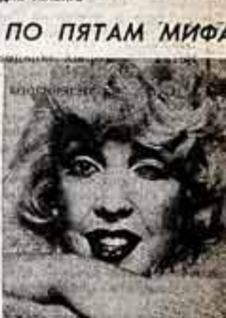
Популярность и трагическая кончина известной американской актрисы Мэрилин Монро до сих пор не дает покоя многим.