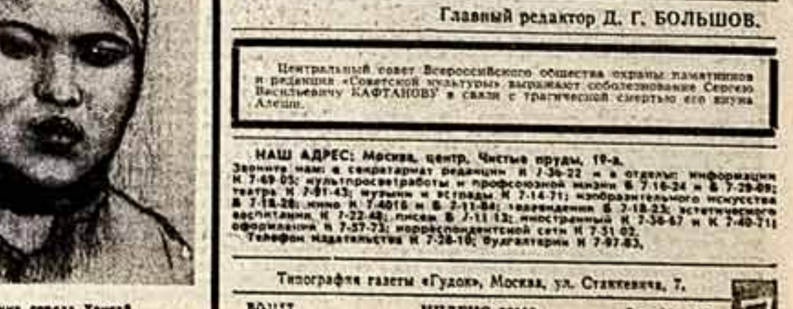
Облачение города Конга.