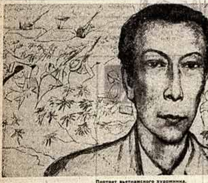
Портрет вьетнамского художника.

Типография газеты «Гудок», Москва, ул. Сталквечка, 7.