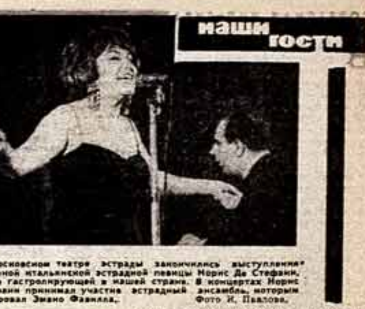
В Московском театре эстрады замечательная выступление певицы Ирины Де Стефанис...