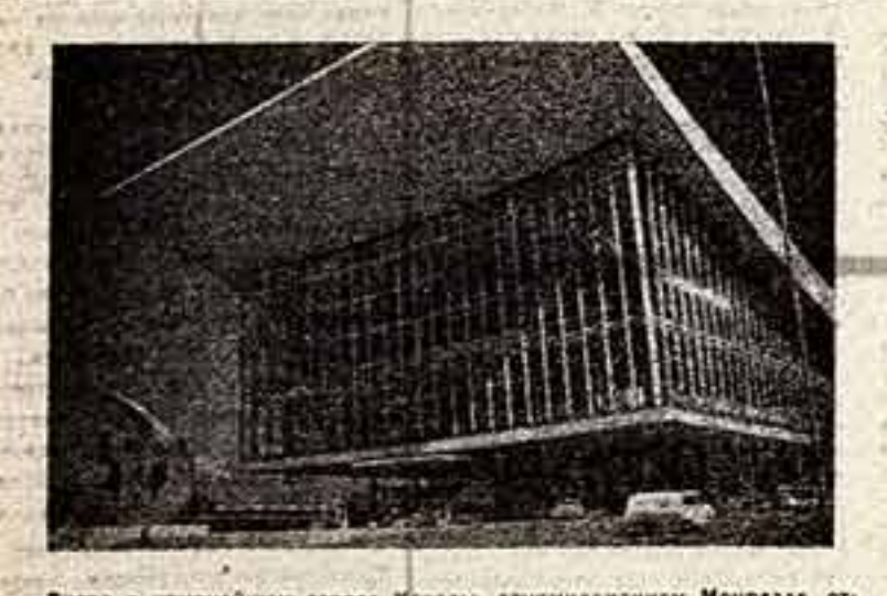
Вчера в крупнейшем городе Магады, двухмиллионном Монреале, открылась Всемирная выставка 1967 года. В ней принимают участие около семидесяти стран мира. Павильон Советского Союза, который вы видите на снимке, — один из самых крупных. Его экспозиционная площадь равна 13 тысячам квадратных метров, максимальная высота — около два метра. При павильоне имеется кинотеатр на 600 мест. Девиз советского павильона: «Все во имя человека, для блага человека». Посетители павильона СССР смогут ознакомиться с тем, чего достиг народ нашей страны за 50 лет существования Советской власти, Большой раздел павильона занимает экспозиция, посвященная культуре и искусству народа СССР.

В СЕРОСИЙСКИЙ СМОТР зрительскому фильму, посвященному полувековой годовщине Октября, будет проходить в Москве с 6 мая в ЦДР. ТРАДИЦИОННЫЙ кинофестиваль «Таллин-1967» пройдет в столице с 11 по 14 мая. Его организатор Министерство культуры СССР. Среди участников — ГИЛСМР и Таллинский хористический ансамбль. В этом году фестиваль посвящается 50-летию Советской власти. В нем примут участие ансамбли из братских республик: Азербайджан, Грузия, Дагестан, Литва, Украина, Эстония, а также городов Москвы, Ленинграда, Кубышевца, Новосибирска, Казани и других. Четырнадцатый по счету фестиваль приобретает солидную международную авторитет. В нем участвуют коллективы из Англии, Польши, США, Финляндии, Мексиканской и Швейцарии, выставляющих программы на фестивале. В программе главного диалогового события года предусмотрены выставки, фотошоу, фольклорные грандиозные, сценические выступления, соревнования, парады, танцевальные ансамбли.