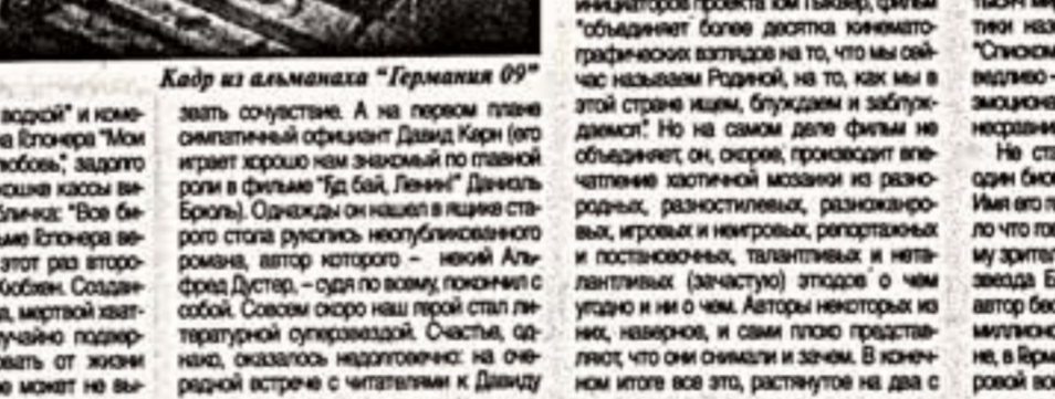
Кадр из альманаха "Германия 09"

Фестиваль немецкого кино в Москве. Кинофестиваль немецкого кино в Москве состоялся в эти выходные в рамках программы "Германия 09".