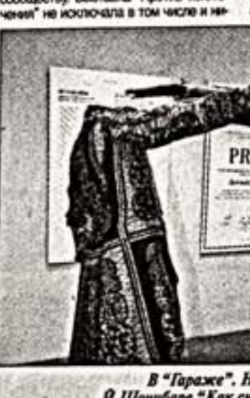
В "Гараже". На переднем плане инсталляция В. Шонборера "Как свети две головы зары", 2006 г.