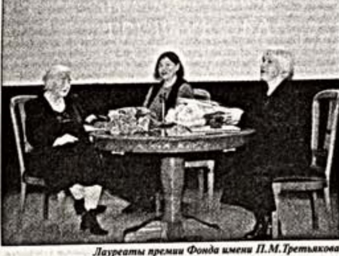
Лауреаты премии Фонда имени П.М.Третьякова