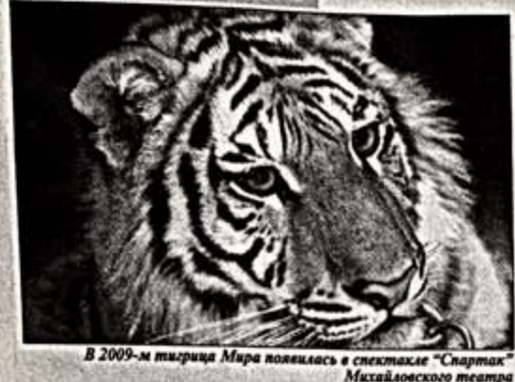
В 2009-м тигра Мира поклялся в спектакле "Спартак" Михайловского театра