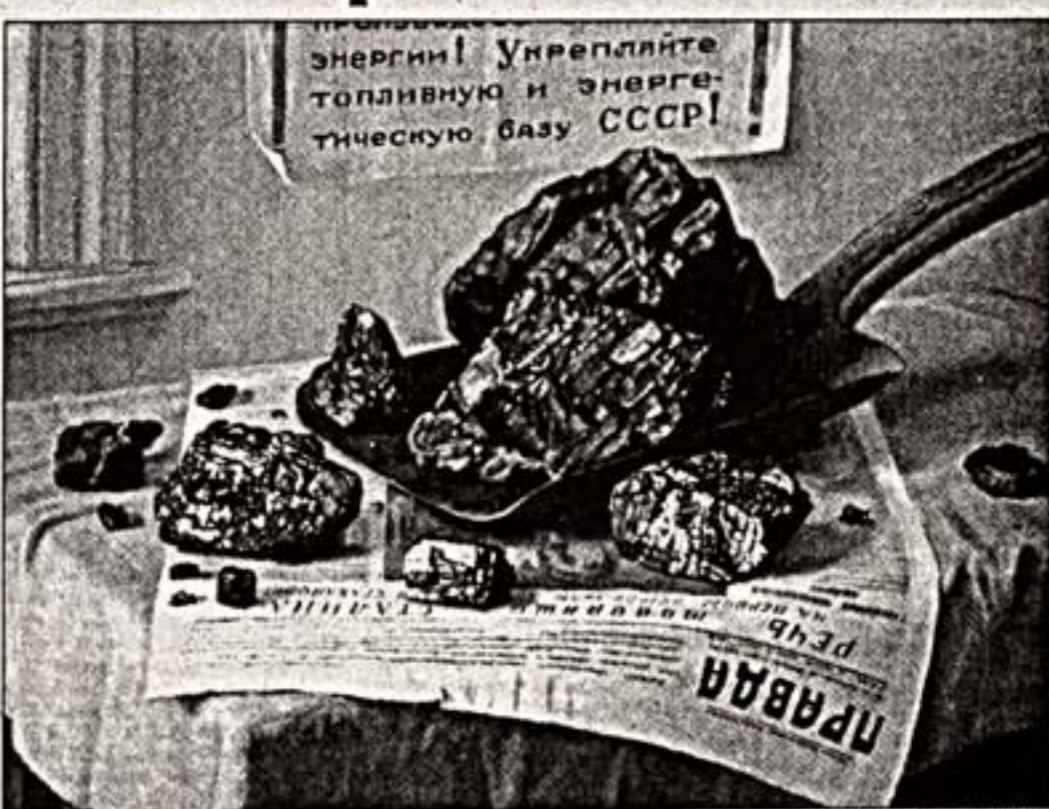
В.Лукин. "Уэльс Кривбасса". 1938 г.