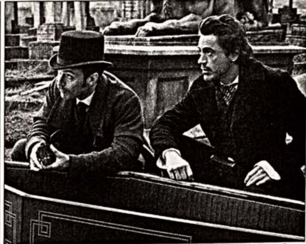
Кадр из фильма. Так выглядят Холмс и Ватсон.

Если убрать звук и титры в новом фильме Гая Ричи "Шерлок Холмс" и смотреть на экран в полной темноте, то вы бы не заметили, что перед вами фильм знаменитой пары Конан Дойла.