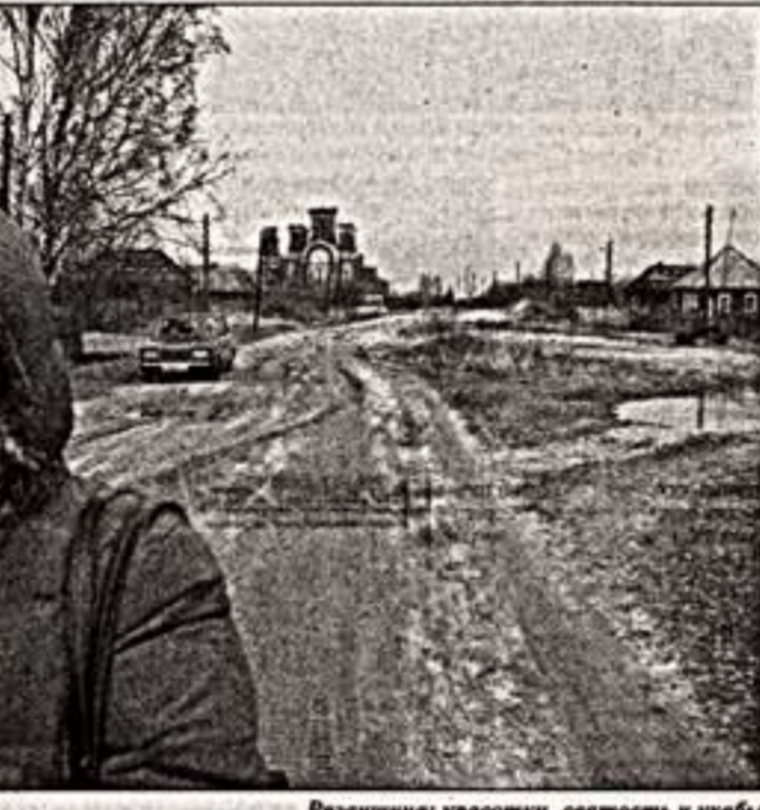
Рязанцы: красотища, святость и уютища

Грядущие длинные-продолгие праздники требуют внимания. В графике и расписании смысле. Не дала себе покоя календарь, который не оставляет в праздничные дни. Далеко не все праздники отмечаются в один день.