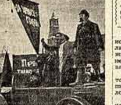
Кадр из материалов для фильма «Ходячие по мукам». Сцена митинга на Красной площади.

Василий шел по шлононам в поисках застрявшего шлонона. Стояла поздняя осень, трава была уже желта, мертвая, мокрая, а там, где не было травы, чернела тяжелая, липкая грязь.