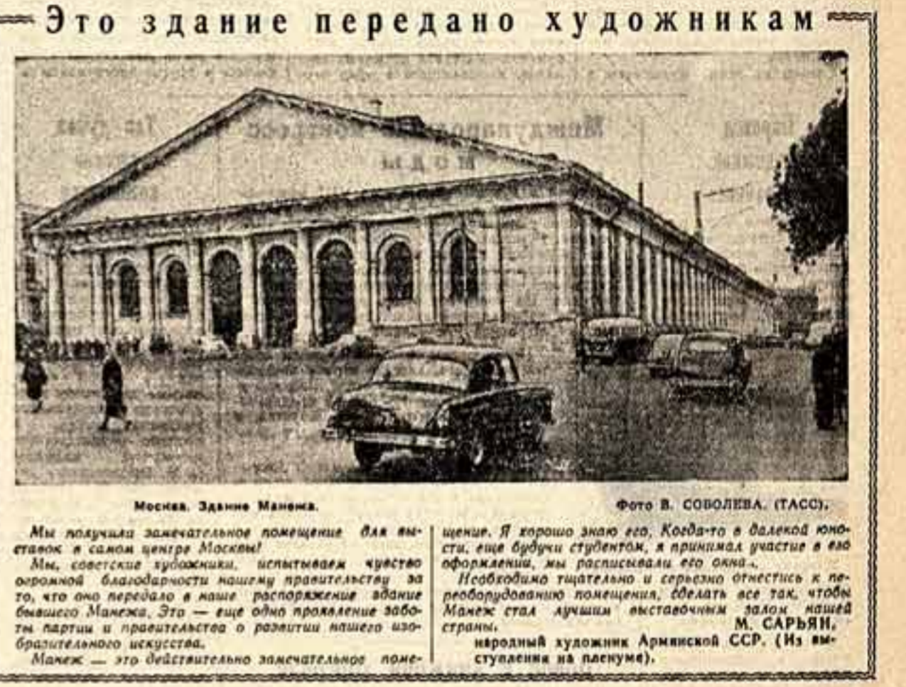
Это здание передано художникам

Обсуждение хозяйственных вопросов на пленуме показало, что Художественный фонд Союза художников СССР еще не стал достаточно ирентной и деятельной