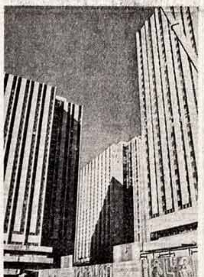
Через месяц гостеприимно распахнут двери для корпуса олимпийского стадиона в Нахбино. А это около 10,000 мест в комфортабельных номерах со всеми удобствами, ресторанами, барами, саунами для отдыха, парками и пляжами.