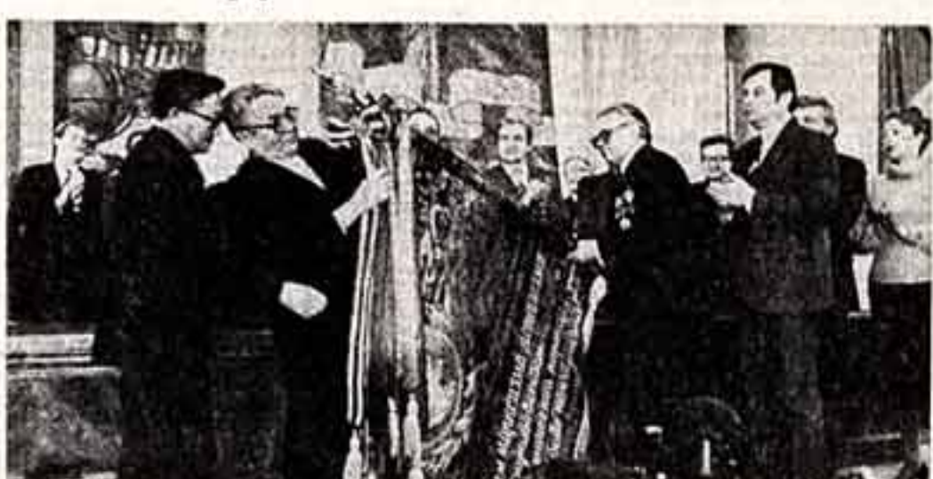
Во время вручения МГУ высшей награды МНР.

В яркий праздник советско-монгольской дружбы вышло 19 марта торжественное собрание колхозников Московского государственного университета, посвященное вручению МГУ высшей государственной награды МНР — ордена Сух-Батора.