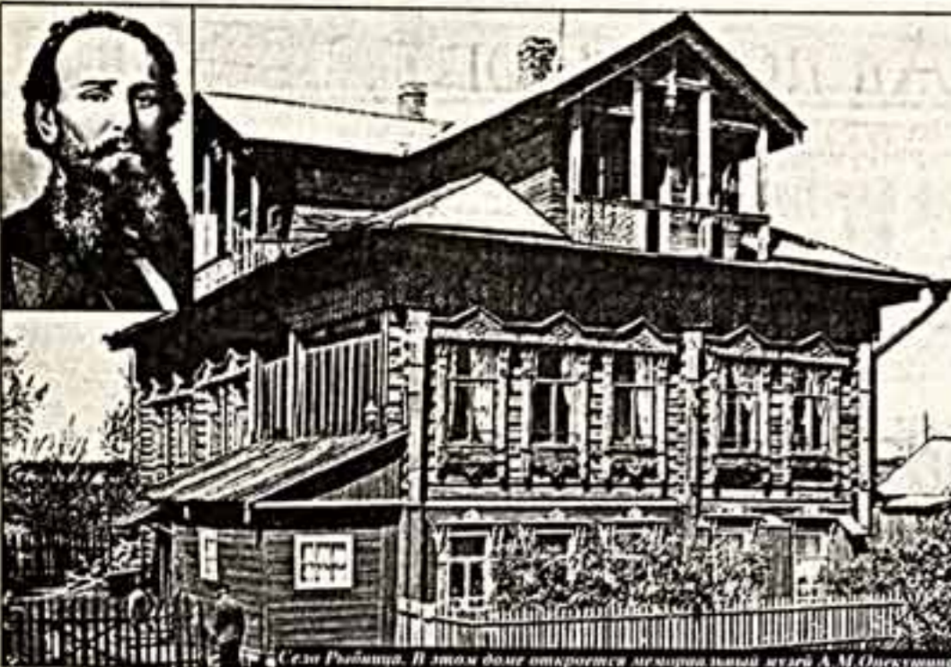
Сезон Рыбниц. В этом доме откроется мемориальный музей А.М.Опекушина

Сочинения британцев о России представлены в специальном разделе экспозиции, организованном по принципу "открытой книги", в нем, кроме самих изданий, помещены иллюстрации, выбранные авторами для своих произведений.