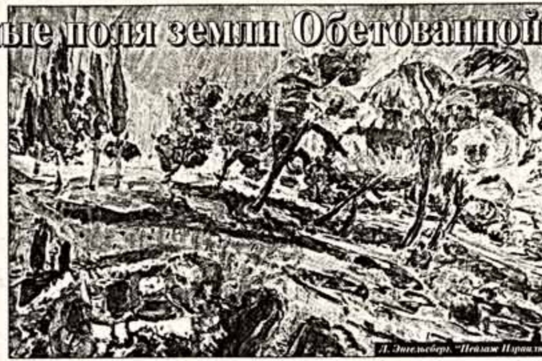
П.Энгельсберг. "Пейзаж Израиль"

В Музее Востока открылась выставка "Пейзаж Израиль", где представлены опыты современных израильских художников в области живописи, графики и фотографии. Из всех изобразительных искусств для Израиля важнейшим считались дизайн и городская скульптура, во всяком случае, о прочих свершениях до настоящего момента было известно крайне мало. Выставка, организованная музеем и Посольством Израиля, таким образом, может восприниматься как акция просветительская. За что нельзя не быть благодарным этим людям — учреждениям.