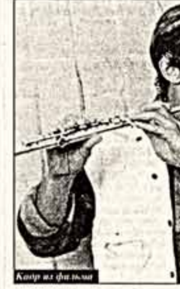
Копия из фильма