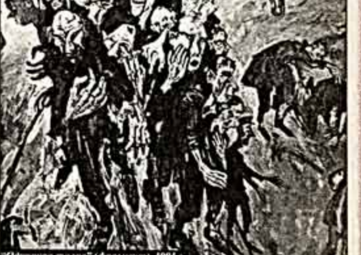
"Одесская тема" (фрагмент), 1991 г.