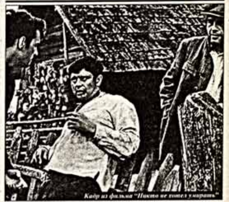
Кадр из фильма "Никто не хочет умирать"

Многие талантливые люди просто-напросто не вписались в новую жизнь. Если ты работаешь добросовестно, то и не чувствуешь никакого дискомфорта. Мне другое не нравится. Пробило восемь часов, и человек, как по заказу, несет куда-то, снимается, например, бросая незаконченное в театре. Профессия все больше переходит в какое-то ремесло. Раньше мы на часы не смотрели, работали столько, сколько требовалось. Только вдруг заметишь, что на дворе-то уже светает. И никому в голову не приходило спрашивать, сколько за это будут платить. Хотелось одного: быть на сцене и хорошо сыграть. Да и сейчас мы делаем более или менее то, что хотим. Нет теперь, конечно, таких театров, какими были в свое время БДТ. "Современник", театр Мильтиниса. Зато теперь, иногда встречаешь старых знакомых, расспрашиваешь, как они живут, и тут выясняется, что человек служит в одном театре и имеет в придачу свой собственный. А театр этот — труппа из пяти человек, разбазарившая всю сумму с целью заработать хорошие деньги. Говорит, что это прогрессивно. И фильмы теперь иной раз делают ради того только, чтобы деньги заработать. Мне не хочется попадать в такие проекты. Должен вам сказать, что получил удовольствие от того, что мне удалось высказать вам то, что обычно никому говорить. Многих интересует какие-то бытовые подробности вашей жизни, а вот что такой Мильтинис, не знает. — Читала, читала о вас в одной российской газете. Чуть ли