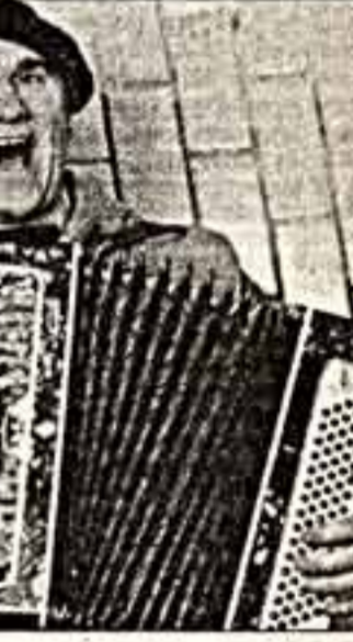
Копия из фильма