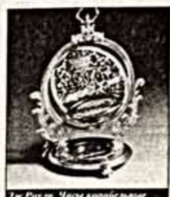
Лит. Рубин. Часы восточного искусства. 1715 г.

бо на декорации английской театральной постановки, либо на обстановку фотографий конца XIX века. Прочие все это, скрользясь судить по самой живописи и поочередно к ней, совершенно прозрительно, незашифровано. От разности и чуждости всех изображаемых реалий. Если и есть здесь "взгляд на диалог", то на диалог несложившийся, сошедший, кажется, не на общий язык и чего-нибудь взаимонепонимого.