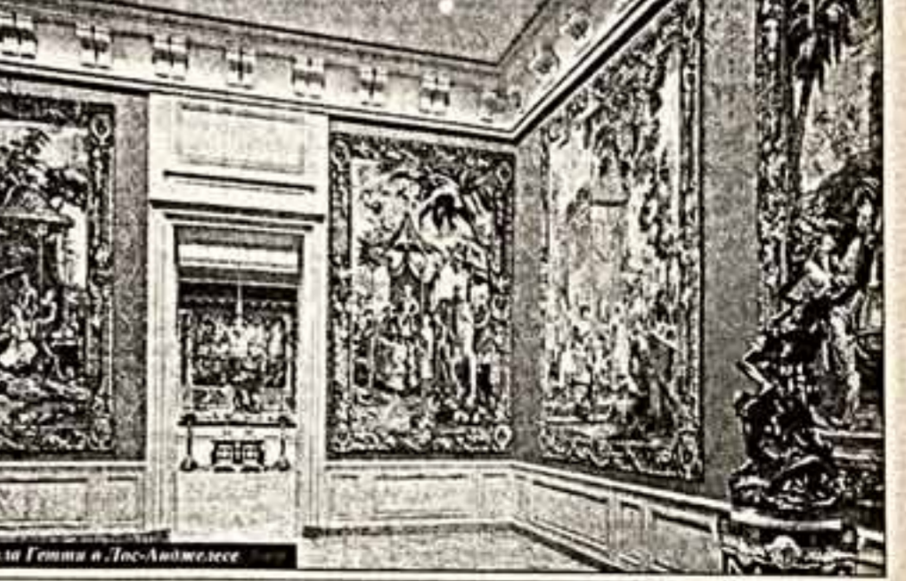
Музей Пола Гетти в Лос-Анджелесе