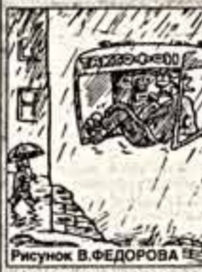
Рисунок В. ФЕДОРОВА

В свободном доступе можно получить прогноз погоды на три ближайших дня, рассчитанный по отдельным регионам или по отдельным странам. Интернет, что сами работники Росгидромета так оценивают оправдываемость своих прогнозов: "от 94 процентов на первые сутки до 85 процентов на четвертые сутки".