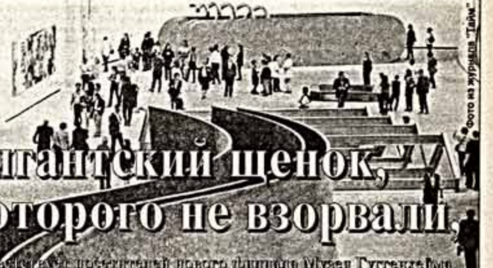
Гигантский шенок, которого не взорвали

по факту покушения на перемещение через таможенную границу России, сопряженное с недекларированием предметов художественного и исторического достоинства народов России". Ведется тщательное расследование обстоятельств незаконного вывоза за пределы России коллекции Харджиева. Российская сторона, отметил Геннадий Тарасов, по официальным каналам неоднократно обращалась к властям Нидерландов с просьбой принять меры, обеспечивающие целостность и сохранность коллекции и имущества Харджиева. Однако, сославшись на то, что имущество фонда явля-