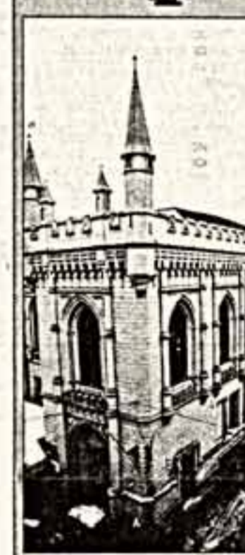
хоронения Иосифа Бродского? Венеция тоже не была для него родным городом...

Венеция тоже не была для него родным городом. Вообще обожаю Италию — с исторической точки зрения. Куда вы едете — в Италию, ну что вам Италия? — Ну как вам сказать, Италия в декабре — это как плавающий Гретта Гарбо.