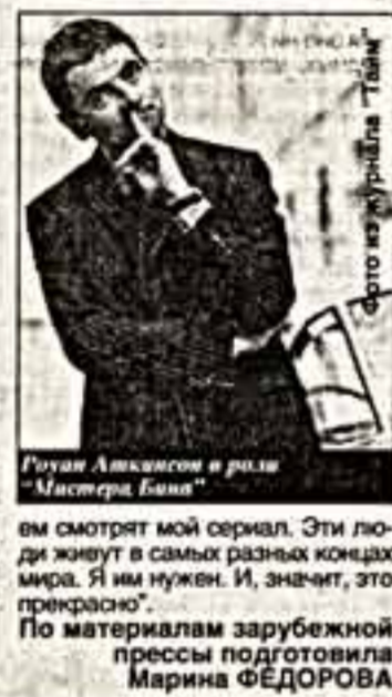
Руйан Атkinson в роли "Мистера Бина"

Наличие расщелины губ, а порою, просто, слурпачий вид на все наши горнолюбивые мистера Бин теперь стал регулярным гостем на американских телеэкранах. Но если мы немного похороним называемого мистера Бина, то американцы быстро и панически обзовали этого героя — "маленький Бин". Замечательный английский комик, лидер и фигура которого выражают невероятную богатую гамму человеческих чувств, эмоций и переживаний. Руган Атkinson сам довольно критично относится к тому, что делает, однако очень любит своего персонажа. Хотя и высказал однажды такую мысль: "Большинство моих друзей не троят время на "Мистера Бина". Они считают, что мой юмор слишком приземлен, рассчитан на неприхотливого зрителя. Может быть, они и правы, однако меня греет мысль, что все остальные люди с удовольствием"