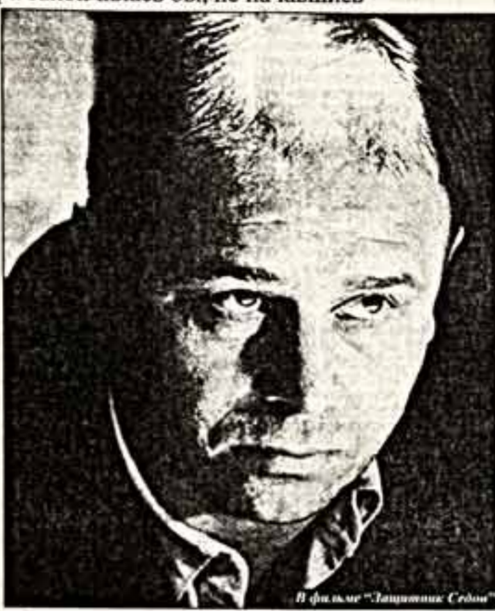
В фильме "Защитник Седов"