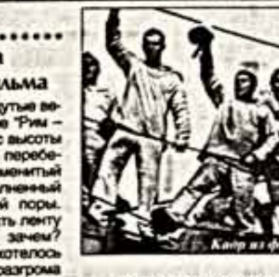
Копия из фильма "Американские голубы"

Улицы веного города, продутые ветром освобождения, в картине "Рим — открытый город". Увиденная с высоты времени фигура девушки, перебежавшая дорогу танкам, — знаменитый кадр из "Третьей империи", исполненный замечательного трагика военной поры. Можно и дальше разгребать ленту исторических кадров, но зачем? Слишком очевидно то, что хотелось бы просто напомнить: после развала фашизма — итальянский "неорреализм", после сталинизма — кинематограф "оттепели". Социальные рубрики отмечают экранные потрясения. И так каждый раз. К примеру, французская "Юная воля" тесно связана с событиями 1968 года. Не говоря уже о феномене "советского фильма", который возник после окончания гражданской войны, был некогда превознесен, а потом "опущен" старшими горничными "террестрической" критики.