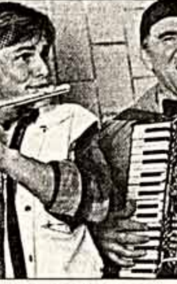
Копия из фильма