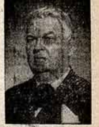
МИХАИЛ САДОВЯНУ, писатель, общественный деятель (Румынская Народная Республика).