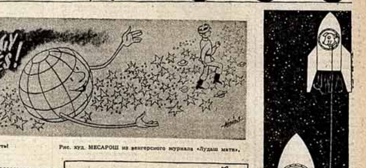
Рис. худ. МЕСАРОШ из венгерского журнала «Лудаш мати».