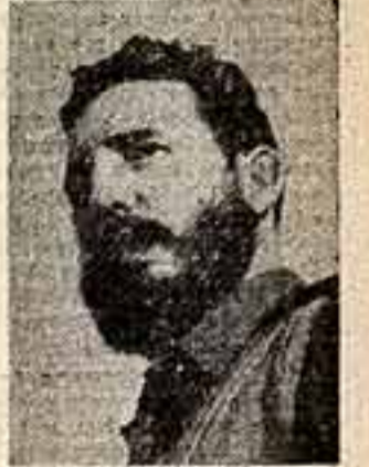
ФИДЕЛЬ НАСТРО РУС, общественный и государственный деятель (Республика Куба).

ЛАУРЕАТЫ МЕЖДУНАРОДНОЙ ЛЕНИНСКОЙ ПРЕМИИ «ЗА УКРЕПЛЕНИЕ МИРА МЕЖДУ НАРОДАМИ»