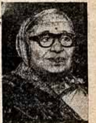
РАМЕШВАРИ НЕРУ, общественная деятельница (Индия).