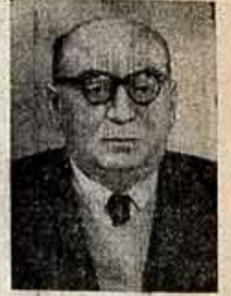
АНТУАН ЖОРЖ ТАБЕТ, архитектор, общественный деятель (Ливан).