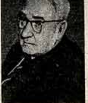
УИЛЬЯМ МОРРОУ, общественный деятель (Австралия).