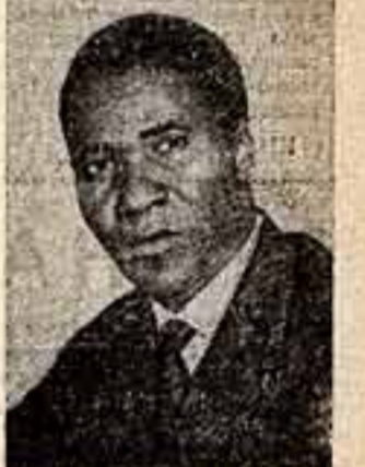
СЕНУ ТУРЕ, общественный и государственный деятель (Гвинейская Республика).