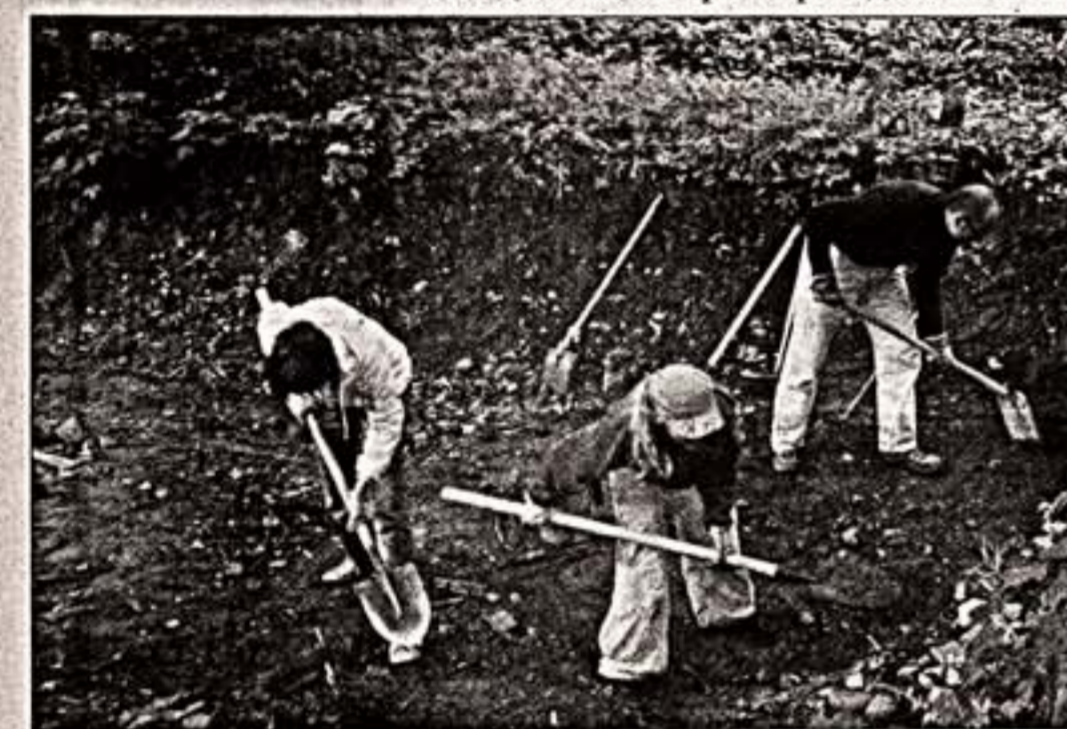
Волонтерский лагерь не принесет денег, зато подарит знания и дружбу

С начала июля в Тверской области близ города Осташкова проходит Всероссийский образовательный форум "Селитра-2009". За восемь дней (каждый на форуме длится около десяти дней) на форумах побывает тысяча человек. Открывался "Селитра-2009" громко и торжественно, с использованием современных технологий, в площадке которой на сцене с молодежной артистичностью выступил Президент РФ Дмитрий Медведев.