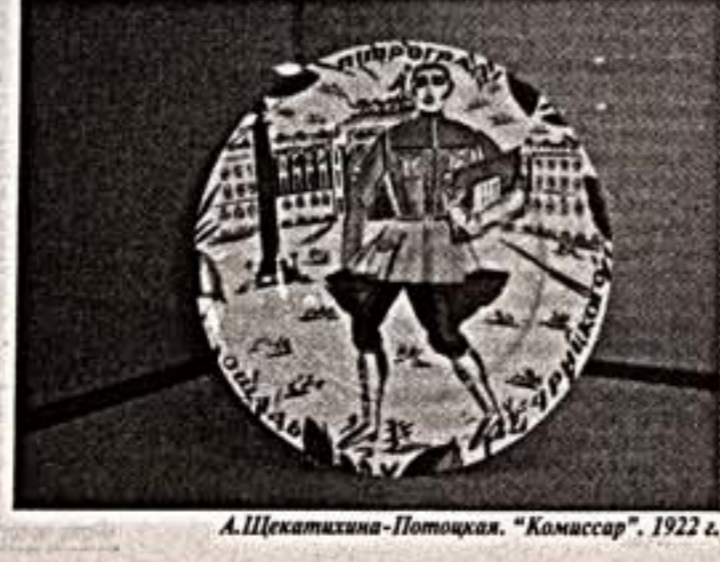
А.Шекатихина-Потоцкая. “Комиссар”. 1922 г.