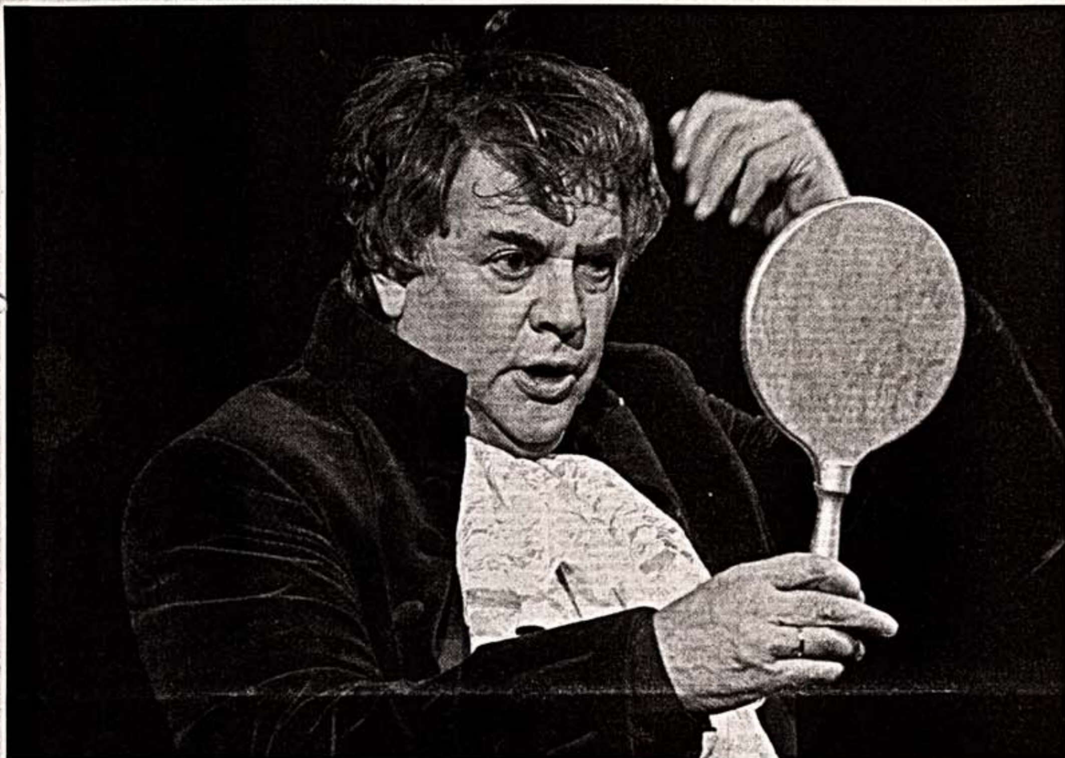
А.Ширвиндт — Моцарт в спектакле "Кубла самозванец"

"Маска — это то, от чего я завишу", — некогда признавался Александр Ширвиндт. В сознании же многогранной артистической личности немыслимо ироничного юмора. Ширвиндт, и его многолетняя преподавательская деятельность в Театральном институте имени Б.Шуккина, и совсем недавнюю роль художественного руководителя театра сатиры, конечно, никак не укладываются в рамки вышеозначенного мифа. Да и в самом роле, входящем в сегодняшнюю репертуарную классику, словно постоянно переключаются две исторические творческие судьбы: одна восходит к эстраде, другая — к академическому театру. Между тем и театральная биография Ширвиндта, и его многолетняя преподавательская деятельность в Театральном институте имени Б.Шуккина, и совсем недавнюю роль художественного руководителя театра сатиры, конечно, никак не укладываются в рамки вышеозначенного мифа. Да и в самом роле, входящем в сегодняшнюю репертуарную классику, словно постоянно переключаются две исторические творческие судьбы: одна восходит к эстраде, другая — к академическому театру. Между тем и театральная биография Ширвиндта, и его многолетняя преподавательская деятельность в Театральном институте имени Б.Шуккина, и совсем недавнюю роль художественного руководителя театра сатиры, конечно, никак не укладываются в рамки вышеозначенного мифа. Да и в самом роле, входящем в сегодняшнюю репертуарную классику, словно постоянно переключаются две исторические творческие судьбы: одна восходит к эстраде, другая — к академическому театру.