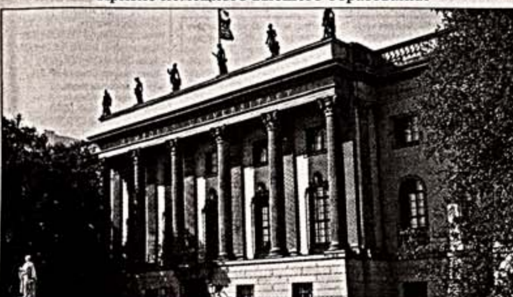
Гумбольдтский университет в Берлине

В нынешнем году Франция чувствует своего известного соотечественника Жака Тати. Париком устроили четыре месячные фестивали (с 8 апреля по 2 августа) вокруг выставки в Синаматек.