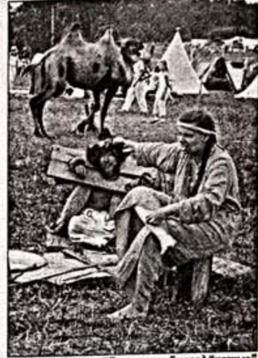
Слева: наследники ратных удалцов. В центре: хоровод на "Сердце Пармы". Справа: "Басурманин" перед "жазмой"