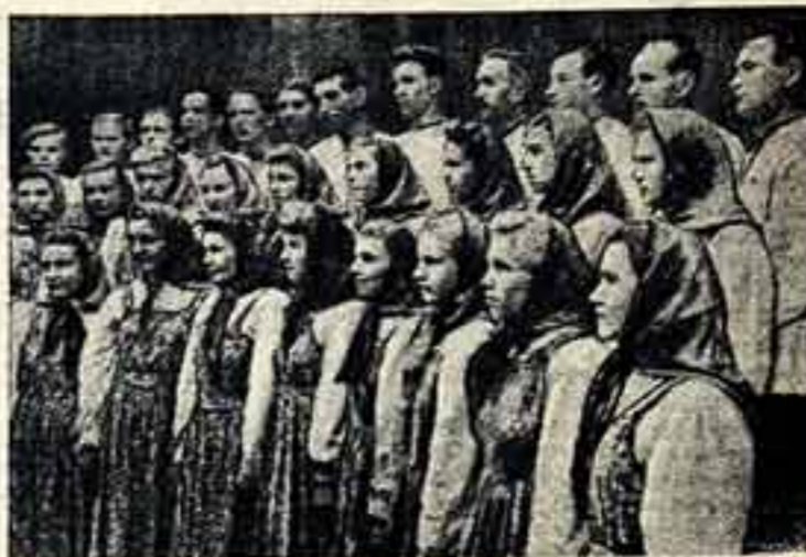
Хор рабочих и служащих Алтайского тракторного завода имени М. И. Калинина на краевом смотре полужука отличную оценку и сейчас выдвинул для участия в заключительном туре Всесоюзного смотра художественной самодеятельности профсоюзом. В репертуаре хора народо-демократические песни и произведения местных авторов об Астане, о борьбе народов за мир. На снимке: группа рабочих и служащих Алтайского тракторного завода — участники хора.