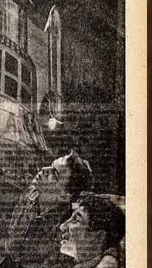
Сцена из спектакля «Пятая и юность» в постановке экспериментального психиатрического театра города Воронежа.

«БЕРЕЗКА» — это название нового киножурнала. Он выходит на экраны. Его размер — одна часть, примерно 300 метров, 10 минут. В журнал включены четыре вещи: шутка «В одном сапоге» — автор С. Михайлов, режиссеры И. Ильинский и А. Колтыраткин, сценка «Задан» — автор Л. Лекер, режиссер Л. Куликов, мультипликационная карикатура «Севка» — художник М. Абрамов и фелетон «Жизнь трупа» — режиссер А. Тутушкин. Главный редактор журнала С. Михайлов, ответственный секретарь И. Вакар, композитор Н. Богословский. Ответственный работник