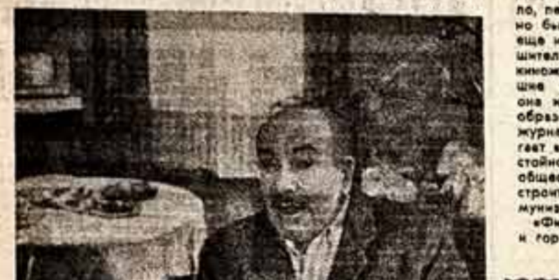
Кадр из киножурнала «Фитиль». 1. И. Ильинский в роли Тютюригина, 2. Е. Моргунов в роли фотографа С. Филлипова в роли «полюшкина», 3. Мультипликация — «Севка».