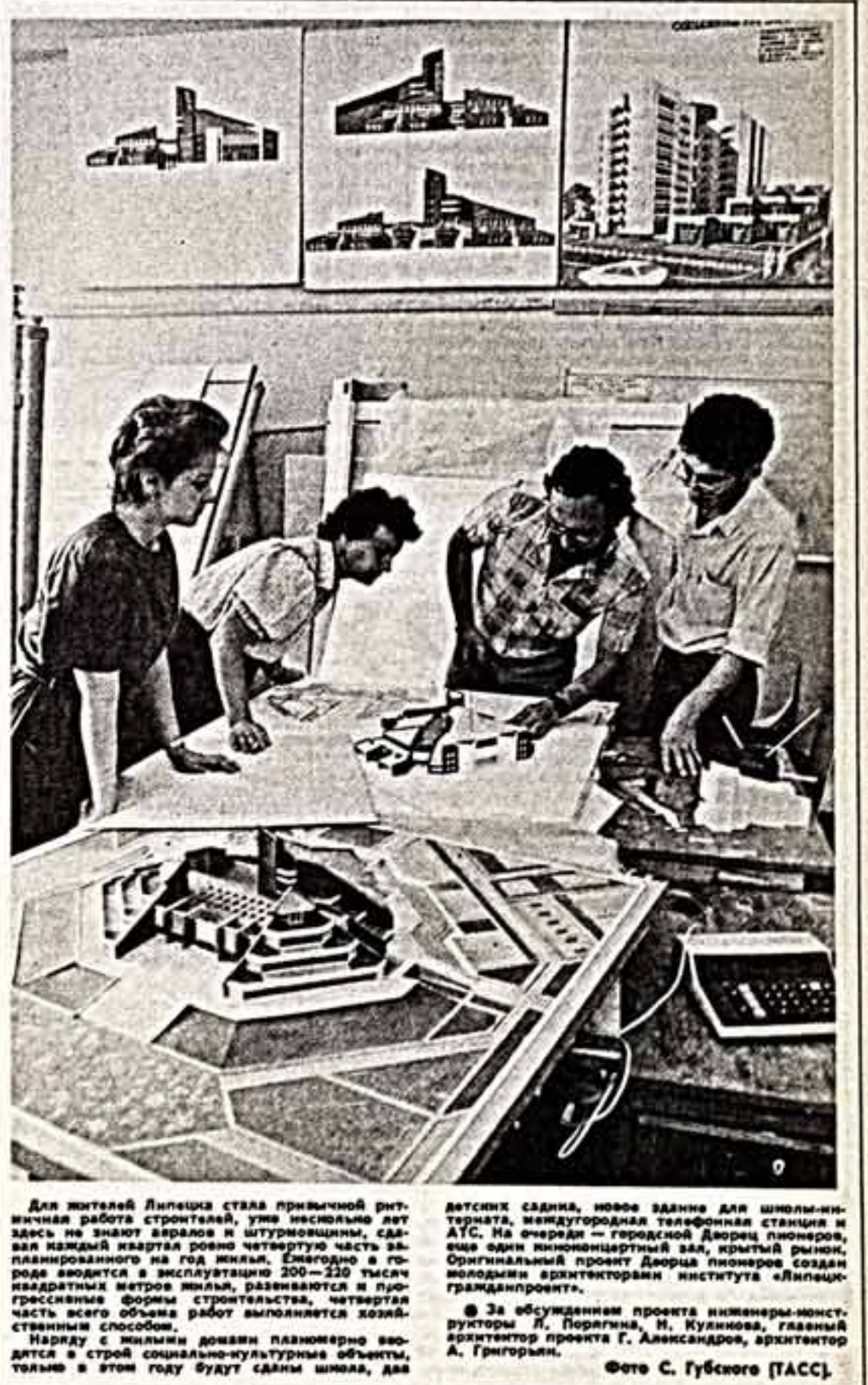
Для жителей Липецка стала привычной рутинная работа строителя, уже несильно летящая на работу архитектора института «Липецкгражданпроект».

Впрочем, это моя личная точка зрения. Есть и другие. Сейчас ведутся споры, обсуждения. Я понимаю, что нас восторжливает: постановление готово, со дня на день будет принято, а еще есть нерешенные вопросы. Но не скандалится ли в подобном подходе «вчерашнее» желание видеть в каждом документе, в каждом принятом решении предписание, своеобразный циркуляр на всю жизнь? Разработанный документ лишь заложил основу для восстановления равновесия между реальной ценностью труда работников культуры, масштабами поставленных перед ними задач и их заработной платой. Дело это архисложное. Но первый шаг сделан, и я не вижу препятствий для дальнейшего пути в этом направлении.