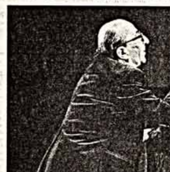
Г. А. Товстоногов на репетиции.

Понятен подкал? Понятен, и опять дает точные указания, как себя вести, и опять далеко отбывает. Когда в финале Чугунова, как го-