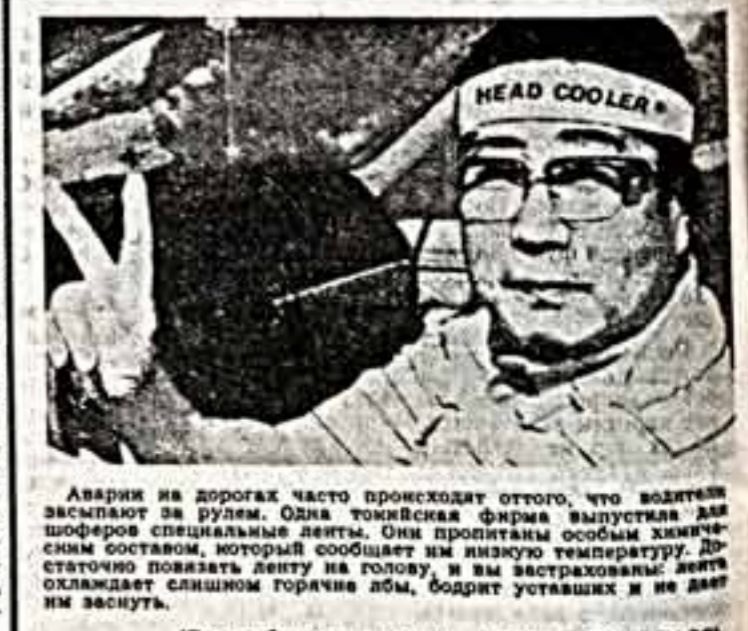
Авария на дорогах часто происходит оттого, что водители засматривают за рулем. Одна токийская фирма выпустила для шоферов специальные линзы. Они пропитаны особым химическим составом, который сообщает им визуальную температуру. Дождь, туман, снег, гололед — все это сразу же выстраивается перед глазами, как будто бы выходящим из лобового стекла. (По сообщениям корреспондентов «СК» и ТАСС.)

Японские любители театрального искусства давно ждали этого события, и вот здесь началось гастроли Московского Художественного театра. Промоушная советская труппа открыла выступления спектаклем «Чайка» по пьесе А. П. Чехова, в котором заняты многие ведущие актеры МХАТ. Долго не смолкали после спектакля аплодисменты благодарных зрителей в заполненном до от-