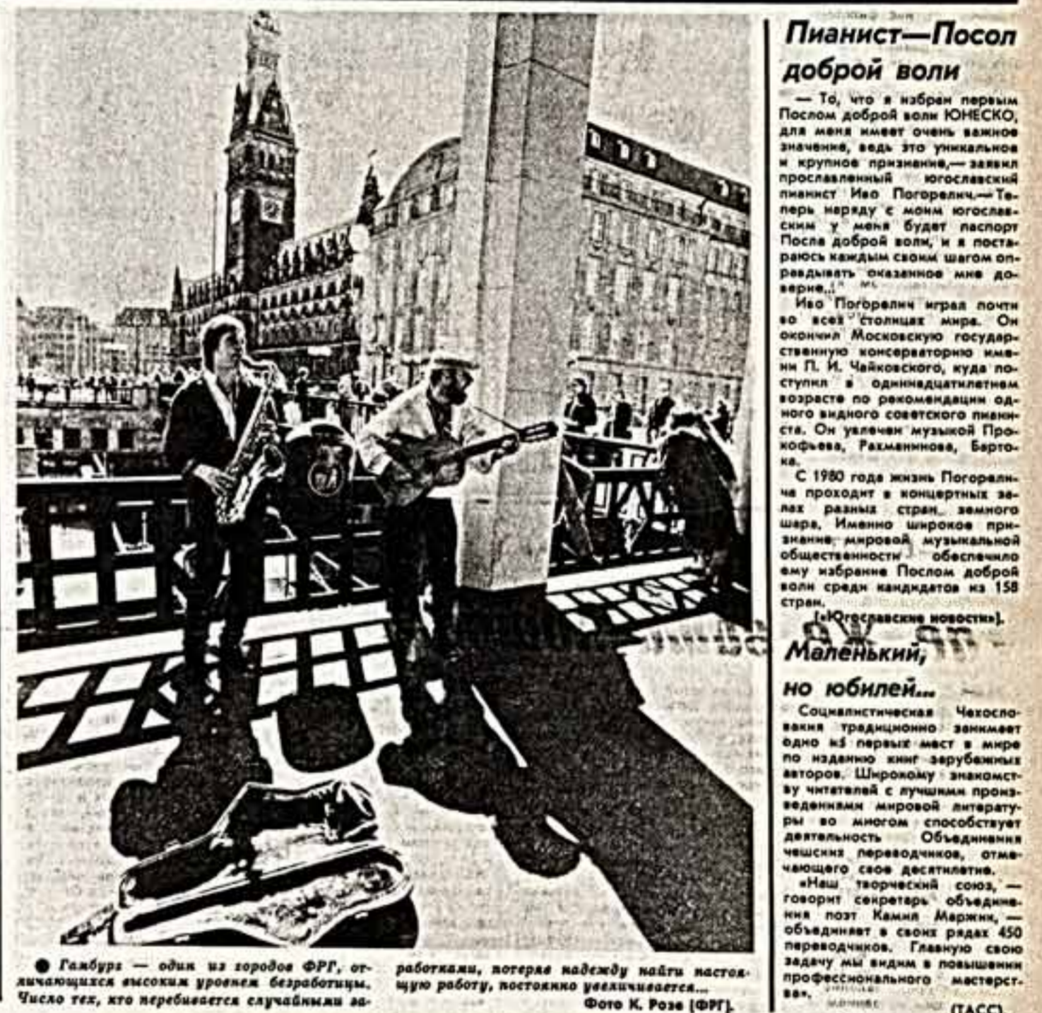
Гамбург — один из городов ФРГ, отличающихся высоким уровнем безработицы. Число тех, кто перебивается случайными заработками, потеря надежды найти постоянную работу, постоянно увеличивается...