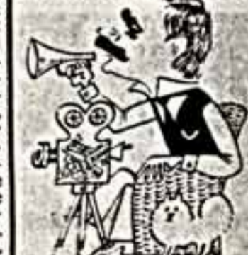
Иосиф Хейфиц, народный артист СССР.