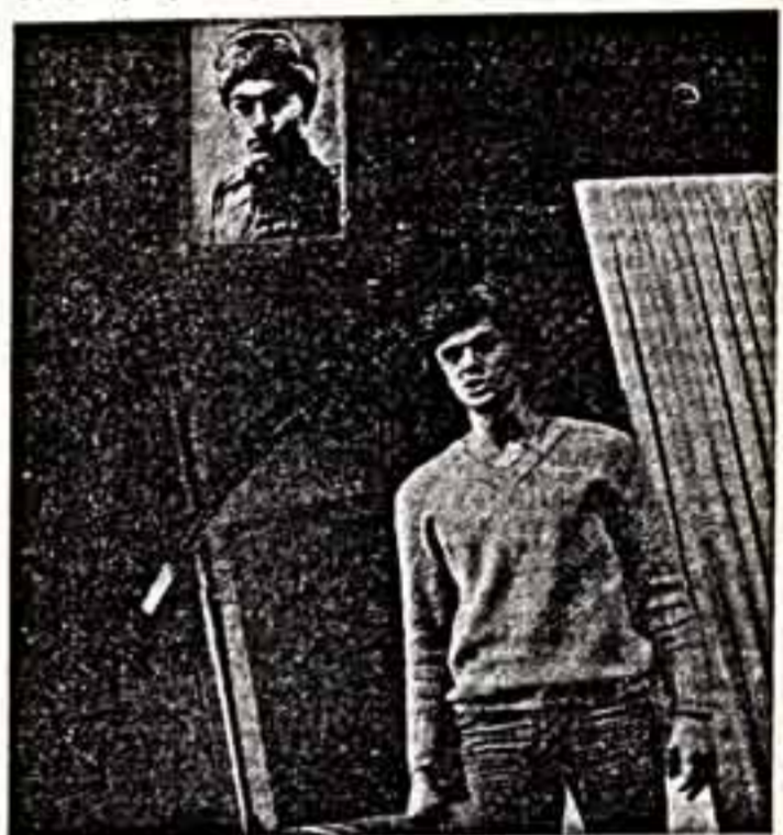
На сцене филармал Малого театра Союза ССР покаялся виновный спектакль Театрального училища имени М.С. Щепкина «В поисках радости» В. Розова...