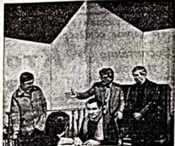
Песни словенского драматурга М. Бора «Звезды вечерние» в переводе Н. Мизгуновского исполняют в постановке Белорусский академический театр имени Я. Купалы...