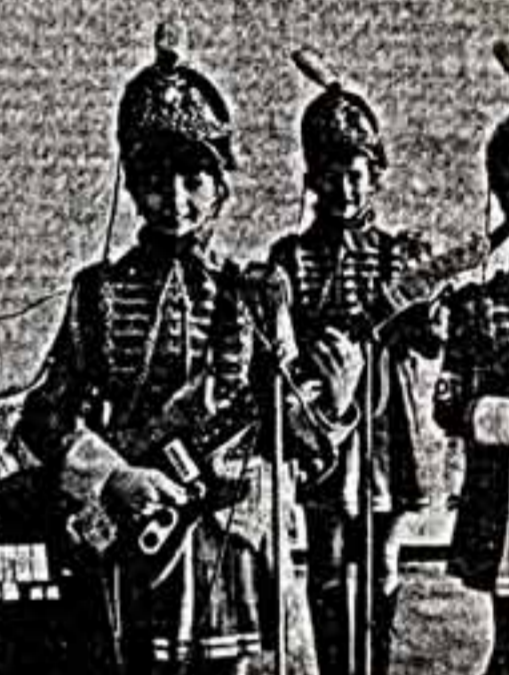
Деятели культуры и техники имени А. М. Добрынина в Ярославле...