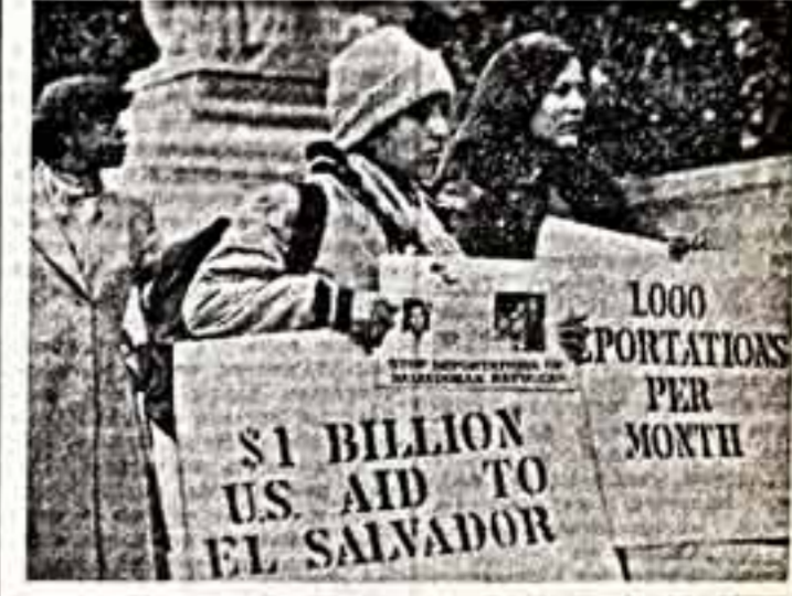
Курс Белого дома в Центральной Америке вызывает респект коллудации прогрессивной американской общественности, которая требует прекратить оккупацию вооруженной силой...