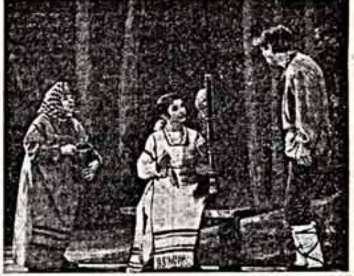
Интересно поставлена известная сказка А. Н. Островского «Снегурочка» в Кож-Перлском окружном драматическом театре имени М. Горького...