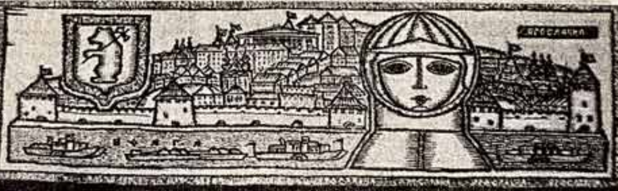
ВЫСТАВКА «ДЕКОРАТИВНОЕ ИСКУССТВО СССР»