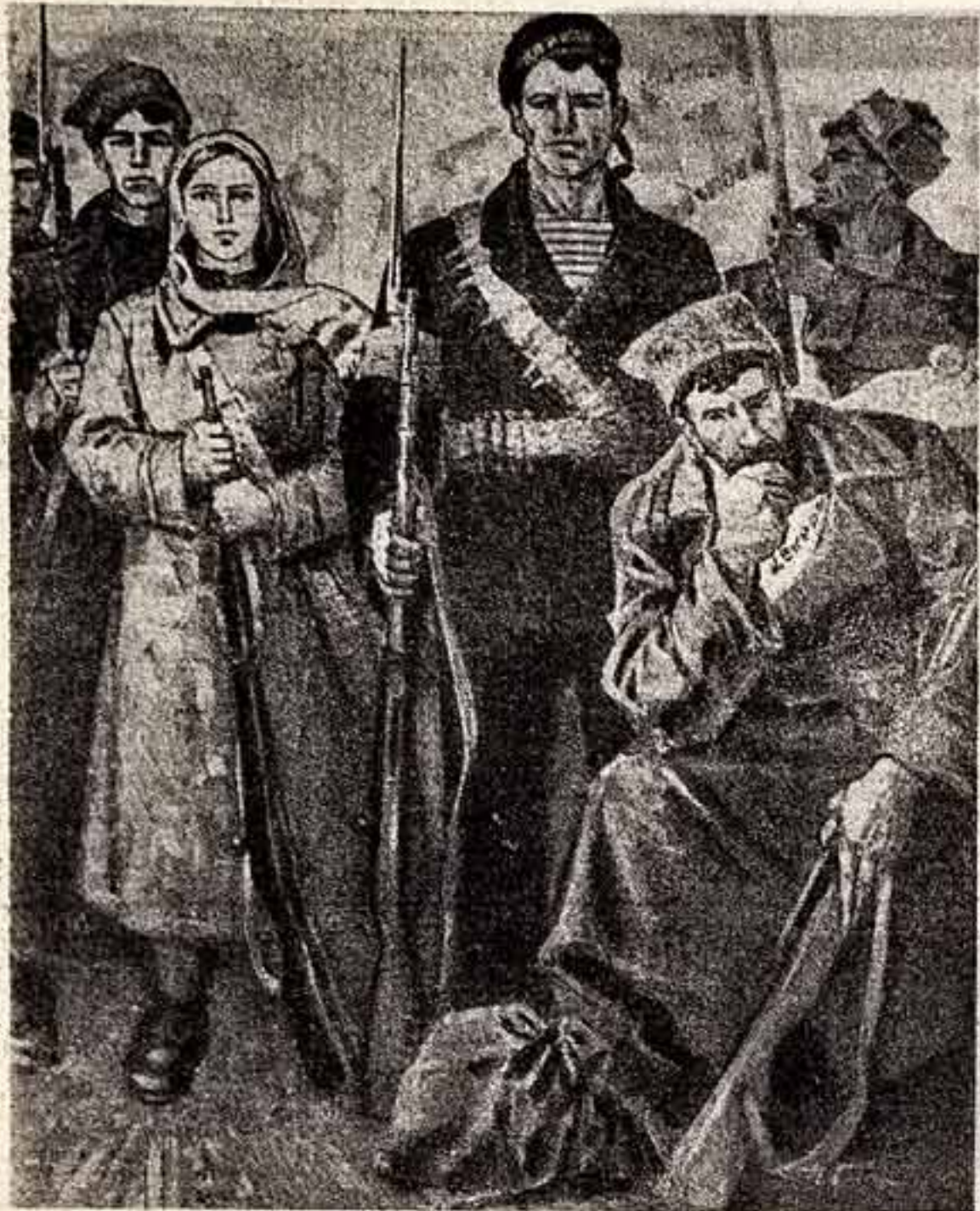
Картина П. Бабака «Мы навд, мы новый мир построим». (С Украинской республиканской художественной выставки, посвященной 50-летию ВЛКСМ).