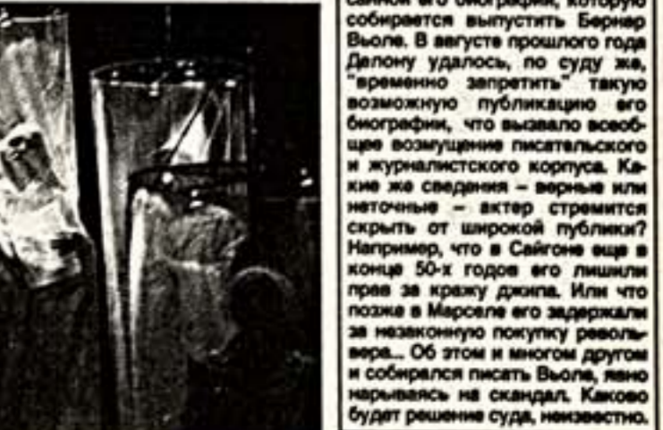
Слева направо: I, II и III акты оперы "Когда время выходит из брегов"