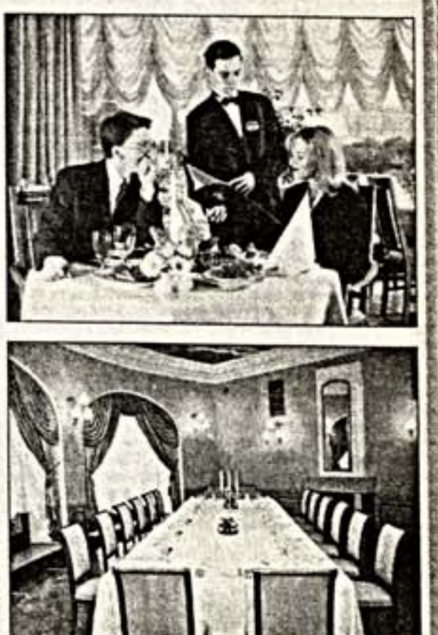
Изюминка «Националя» — ресторан «Московский», которому год назад было присвоено звание лучшего столичного ресторана при гостинице