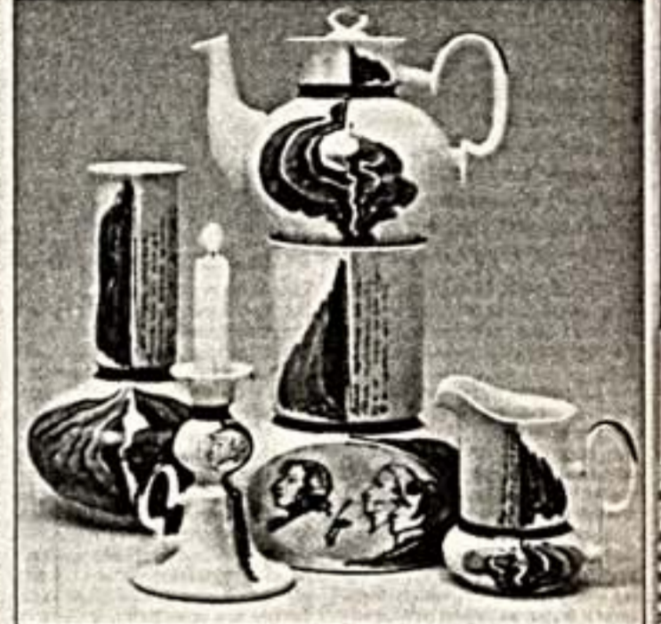
Предметы из чайно-кофейного сервиза "Воспоминание", 1978 г.