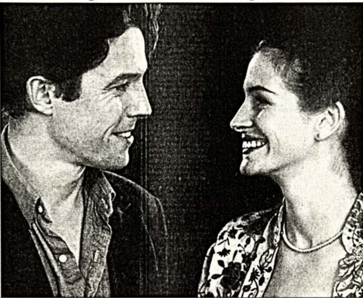
Джюлия Робертс и Хью Грант

В этом фильме коллизия встречи двух людей прямо противоположной ситуации в популярной американской кинокартине "Красотка". А вспоминается об этом еще и потому, что главную роль в новой ленте "Ноттинг Хилл" исполняет знаменитая длинноногая Джюлия Робертс. Суперкрасавица Ричард Кертикс как бы "выворачивает наизусть" любимую сказку о Золушке. Только вместо бедной прудубовидной девушки здесь героиня выступает обманутой, даже разбитой, разведенной англичанкой, хозяйкой небольшого книжного магазина,