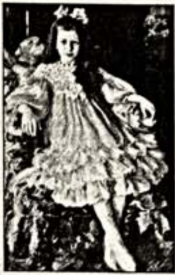
Слева: Н. Боданов-Бельский. "Портрет девушки". Справа: Е. Лансере. "Амазонка на коне Гуттера". Внизу: Ф. Матвеев. "Итальянский пейзаж"

Проходящий в Петере в середине июня Антикварный салон, традиционно организуемый "Экспо-Парком", еще раз подтверждает статус Северной Пальмиры как средоточия художественных ценностей. В течение почти двух столетий российские самодержцы и русская аристократия привозили из Европы живопись и скульптуру, мебель, бронзу, фарфор, серебро. Дворцовый Петербург обставлялся превосходными мебельщиками, а изящные горки и шкафы наполнялись произведениями императорских заводов. И ныне московский антикварный рынок живет, что называется, поставками из Петербурга. В открывшейся 15 июня в Мраморном зале Этнографического музея экспозиция приняла участие множество москвичей: "Традиция и личность" и "Русской модерн". Остальные 17 участников — сами петербуржцы, и треть из них впервые представили себя на широкой арене.