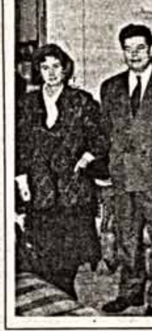
По сообщению корреспондентов «Культуры» и ИТАР — ТАСС.