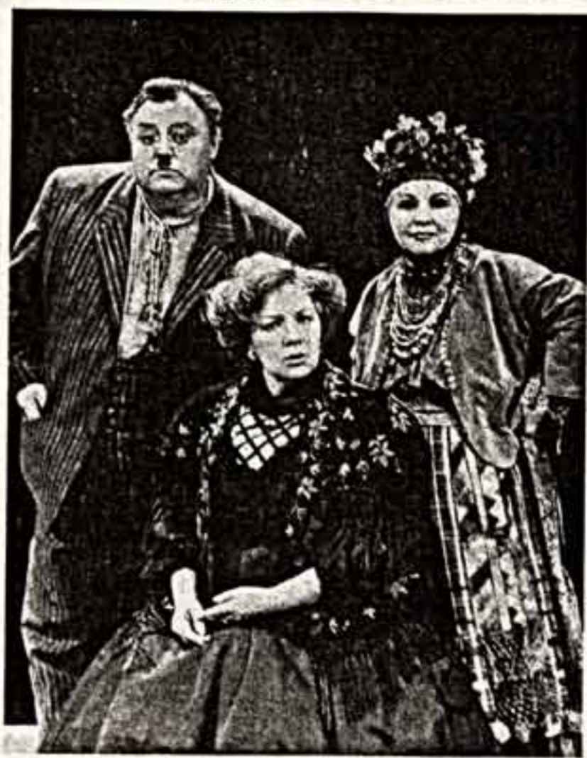
Сцена из спектакля «Блаженный остров» в МХАТ имени А. П. Чехова.