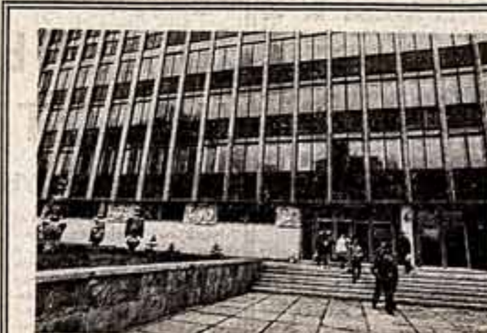
Львовский государственный институт прикладного и декоративного искусства. Из его стен вышло много квалифицированных художников-прикладников.