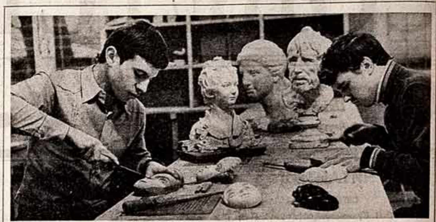
Московскому художественно-промышленному училищу исполнилось 55 лет. За это время его окончили более 5.000 специалистов художников — мастеров по ткачеству, вышивке, кружеву, росписи, короткохвосту, обработке камня, кости и дерева. Выпускники училища направляются на предприятия народно-художественных промыслов.

Семинар открыл директор Дома народного творчества Российской Федерации. Участники семинара обсудили итоги работы за последние годы.