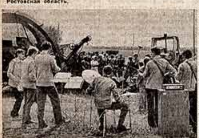
Большой любовью пользуются у тружеников колхоза имени ХХII партсъезда Каменского района Ростовской области самодеятельный вокально-инструментальный ансамбль.