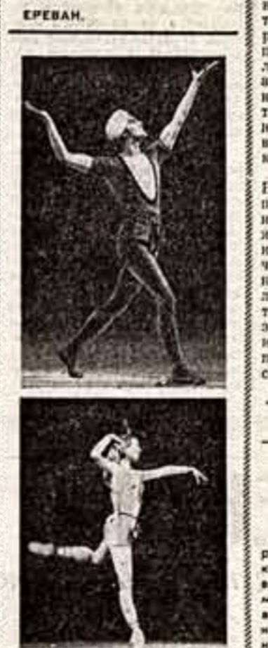
В спектакле «Легенда о любви»...