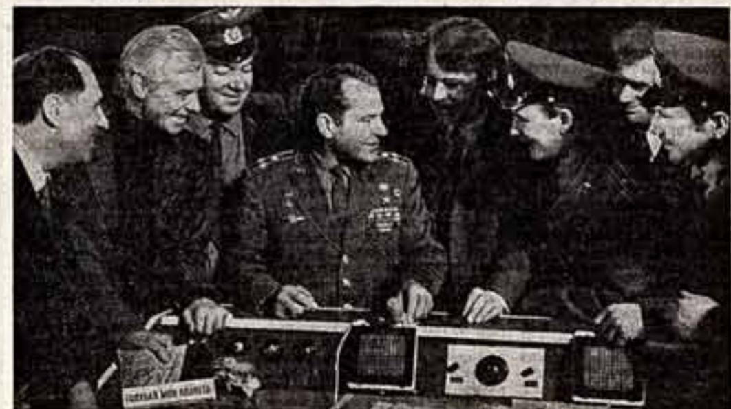
Консультант новой работы театра Герой Советского Союза летчик-космонавт СССР Герман Титов с участниками спектакля «Держиме земляне» после премьеры.