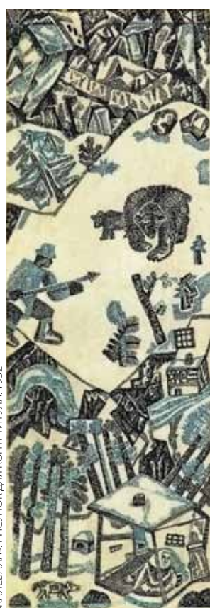
«КАЛЕВАЛА» РИСУНОК ДВА КАРТИНУЛА 1932