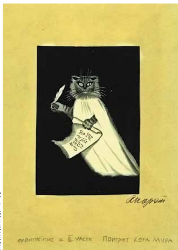
«ПОРТРЕТ КОТА МУРА» 1937