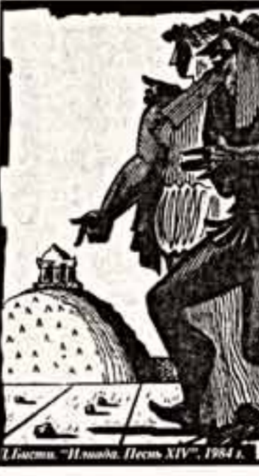
Илиада. Песнь XIV. 1984 г.

вянное оформление книги. Но он всегда находил неповторимый, только этому изданию присущий графический язык. Никогда не повторил ни уже найдено. И вновь открылось было неожиданным, непредвиденным. Неожиданным было и иллюстрирование "Илиады". К поэме обратилось немало художников. Но ни в основном исходили от античной вазовой живописи, считая ее обязательной временной особенностью художественного оформления произведения Гомера. Бисти же не стал следовать устойчивейшей традиции. Он смело использовал греческую изобразительную архаику, но, перефразировав ее в современной графической манере, со своими индивидуальными поворотами и построениями. Он прежде всего стремился показать масштабность события, их историческую значительность не только для эпохи царя Приама, но для последующего развития человечества. Это был уже взгляд человека второй половины XX века. Так, действия, происшедшие в "Илиаде", он вел в замкнутую композицию, тем самым открывая читателю глубины повествования, подчеркивая не только эффективность и драматизм только