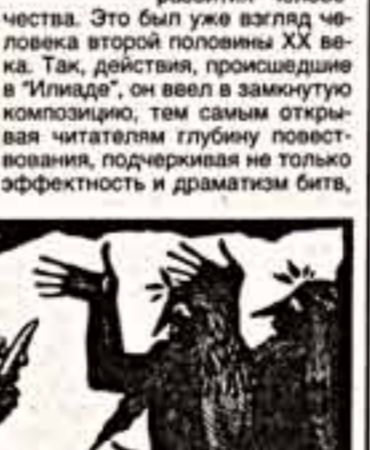
Илиада. Песнь IX. 1984 г.

ястка графических миниатюр, выставки, которая как бы предвещает популярную экспозицию, приоткрывшись на стенде у входа в зал. Но будь она вполне самостоятельной, могла бы стать знаменитым явлением в любом престижном зале столицы. Ведь на ней показывается иллюстрация к поэме Гомера "Илиада", исполненная ныне покойным Дмитрием Спиридоновичем Бисти, народным художником России, действительным членом Российской академии художеств, лауреатом Государственной премии СССР.