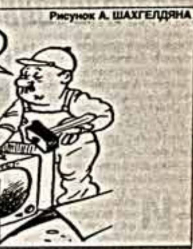
Рисунок А. ШАХГЕДЯНА