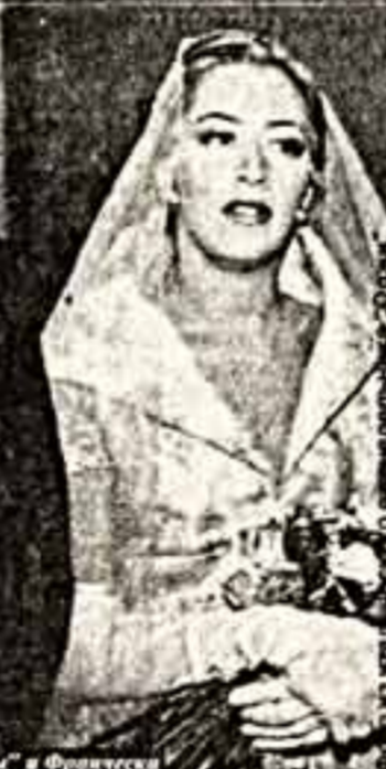
В день свадьбы "на колота Дракулы" и Франческа