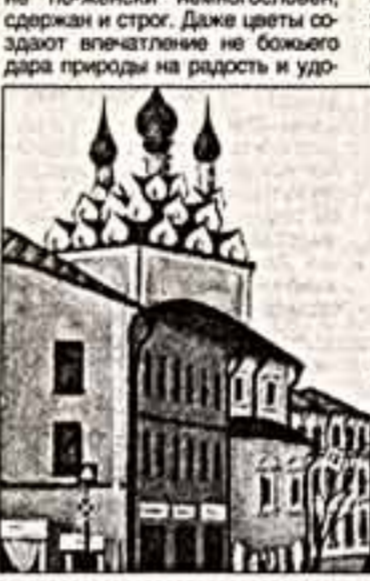
Москва. Тайпик. 1974 г.