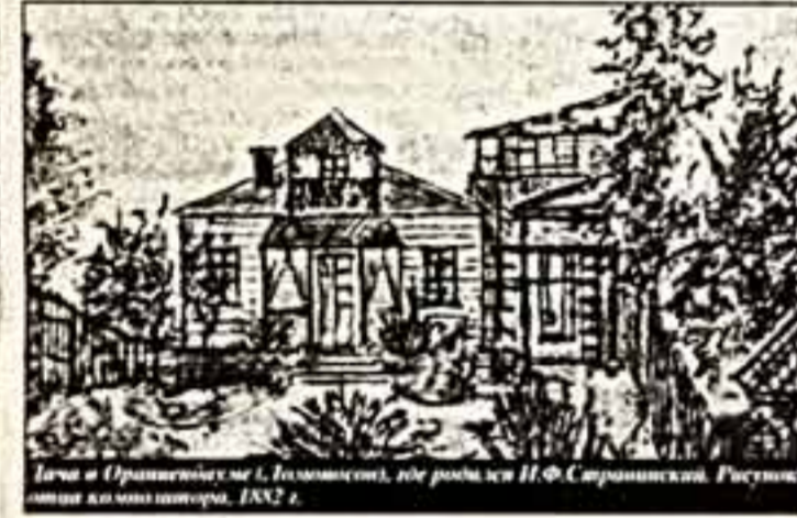
Игорь Стравинский на 1. Ломоносов, где родился И.Ф. Стравинский. Рисунок Ларисы Казанской, 1992 г.