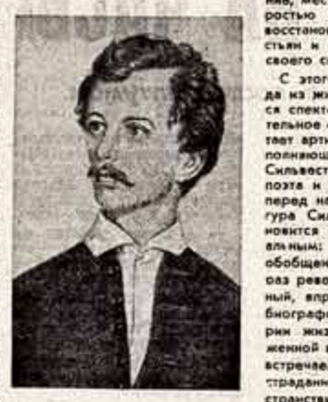
Пожалуй, особенно любопытна последняя премьера Литературного театра — спектакль по поэме Петефи «Апостол» (инсценировка Ивры Тамаче).