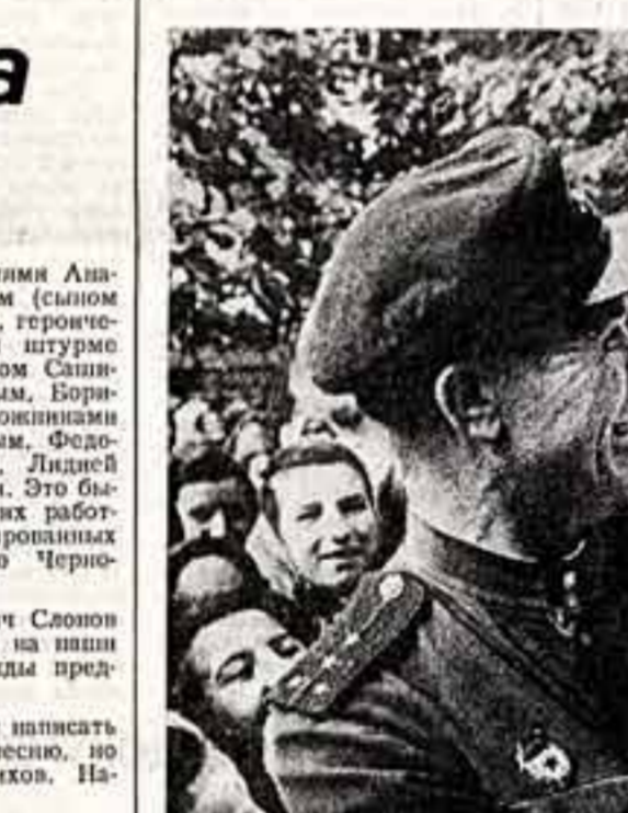
С лейкой и блокнотом