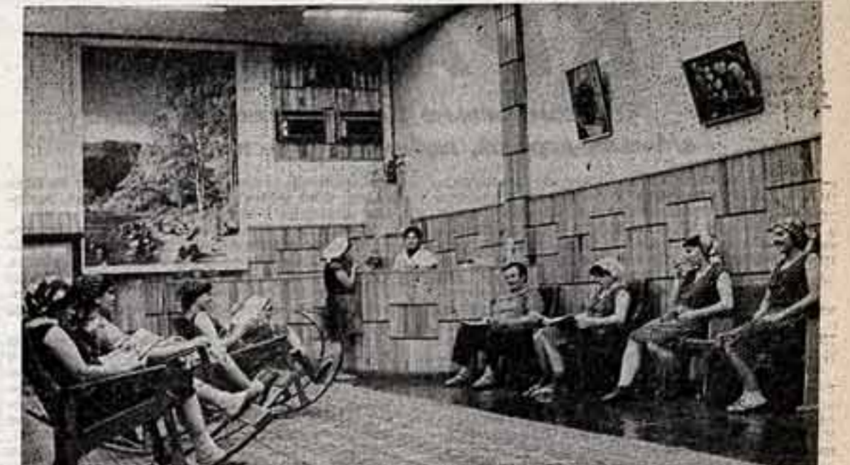
50-летию отметил Ташкентский текстильный комбинат. Начав свою жизнь с небольшой фабрики, в комбинате теперь 7 основных производственных подразделений и 5 филиалов.

И что же в итоге? Ребята продолжают собираться. Но уже в подъезде. Нельзя в классе, нельзя собираться «просто так» и в клубе — вот и обжигаются под одеждой, переоденьте. Создается «своя компания», в которой тебя угостят сигаретой, а то и предложат сыграть в карты или выпить.