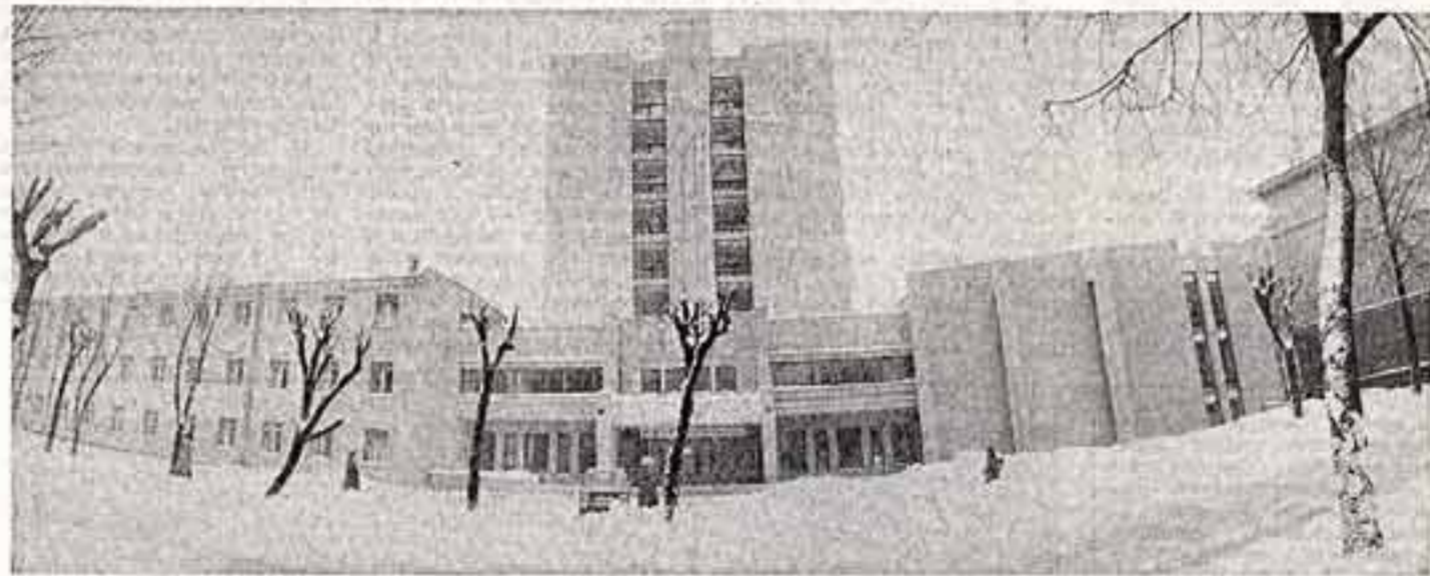
Музыкальное училище им. Римского-Корсакова основано в 1937 году. За эти годы из его стен вышло свыше двух с половиной тысяч специалистов.