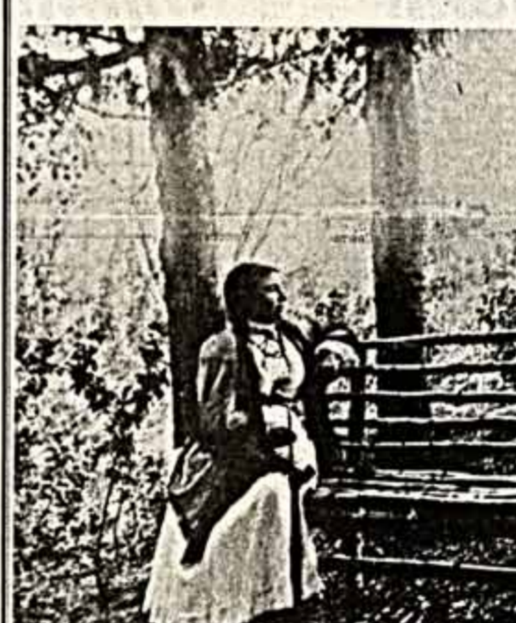
С. А. Толстая на любийой скалке Л. Н. Толстого в Ясной Поляне. 1908 г.