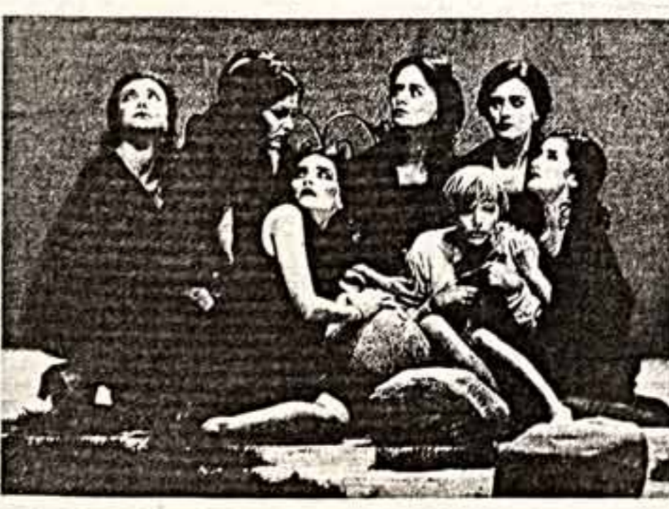
Сцена из постановки Хитмана Гавенсона. «Бразилиана» и постановка Жана Лиссона.

Программа «ИЯ» рассредоточена по восемнадцати сценическим площадкам. Подхода и слухая из них перед началом спектакля, вы еще не знали, за счет чего молодая режиссерка в красных майках. Это, как из незнакомых, часовой фестивалю. Он встретит вас на контроле, вручая бесплатную программу, проведет на ваше место, в антракте обслужит в буфете. И все это — весело, с улыбкой. Улыбкой дежурной! — От нас действительно требуются зрительно и поведенчески приятные вечера. —