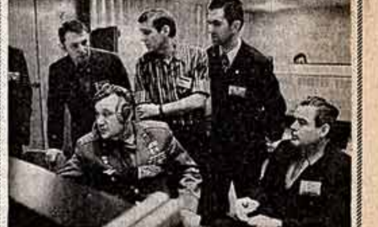
В июле 1975 года состоится экспериментальный полет космических кораблей «Союз» и «Аполлон». Очередным этапом подготовки к этому полету является совместные тренировки советского и американского центров управления полетом. На переднем плане: латвийский актер, дважды Герои Советского Союза Анатолий Филиппович и Андриян Николаев во время проведения совместных тренировок центров управления полетом.

совместную борьбу с нашими идеологическими противниками. Радован для нас был и тот факт, что наше венгерское искусство входит составной частью в творческую жизнь советских деятелей искусства. Пьесы наших драматургов включены в репертуар многих советских театров, книги по венгерской истории мы вывели на витринах магазинов в различных городах Советского Союза, наши грамплстинки покупают школьники и серьезные, и легкого музыканты. Изменил этот подход и развитие наших творческих контактов мы ценим больше всего. Образу говоря, для нас важны не только торжественные праздники культуры, но и просто хорошие будни. В свою очередь мы стремимся, чтобы повседневная жизнь наших людей была украшена встречами с советскими искусствниками. И нам очень хочется, чтобы нынешней осенью, когда в Венгрии будут проходить Дни советской культуры, мы смогли бы ответить взаимностью и так же широко познакомить наших зрителей с прекрасным искусством народов Советского Союза.