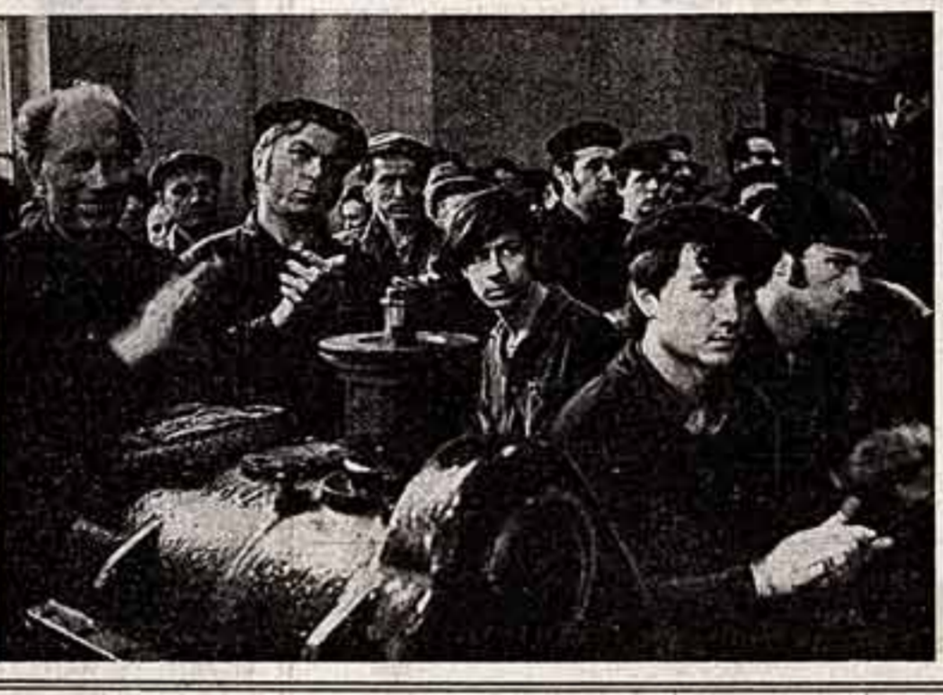
Узы многолетней дружбы связывают коллектив Государственного академического симфонического оркестра Союза ССР и прославленного джаз-соловиста. Как всегда, в апрельские дни музыканты оркестра в главе с народным артистом СССР лауреатом Ленинской премии Евгением Светлановым дали концерт в обеденный перерыв в одном из цехов.

В Советский Фонд мира продолжат поступать взносы от любителей культуры нашей страны. Это их отклик на письмо Героя Социалистического Труда, народного артиста СССР Сергея Образцова (письмо опубликовано на страницах «Советской культуры» 28 сентября 1973 года).