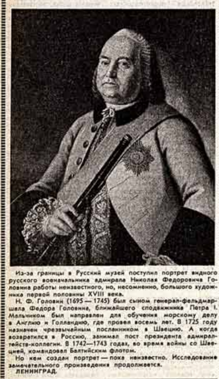
Из-за границы в Русский музей поступил портрет видного русского военачальника адмирала Николая Федоровича Головина работы неизвестного, но, несомненно, большого художника первой половины XVIII века.