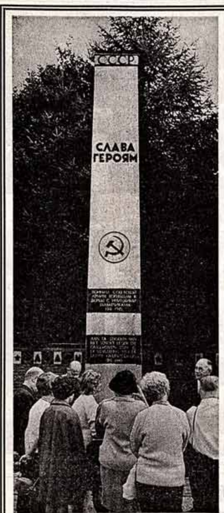
На северном побережье Западной Европы, в низовьях Рейна и Мааса, лежит изрезанная многоотвесными скалами страна Нидерланды...