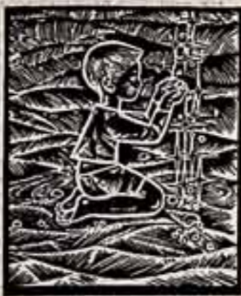
Наше самое большое пожелание — зал для музыкальных занятий...

В ДЕНЬ, когда наша путешествие было описано и турбоход «Советский Союз» подошел к Владивостоку, Московское радио сообщило, что в ближайшем будущем в Якутии ожидается морозы до 51 градуса.