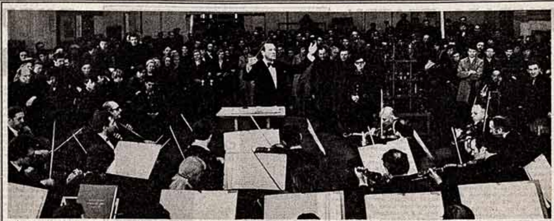
Узы многолетней дружбы связывают коллектив Государственного академического симфонического оркестра Союза ССР и прославленного джаз-соловиста. Как всегда, в апрельские дни музыканты оркестра в главе с народным артистом СССР лауреатом Ленинской премии Евгением Светлановым дали концерт в обеденный перерыв в одном из цехов.