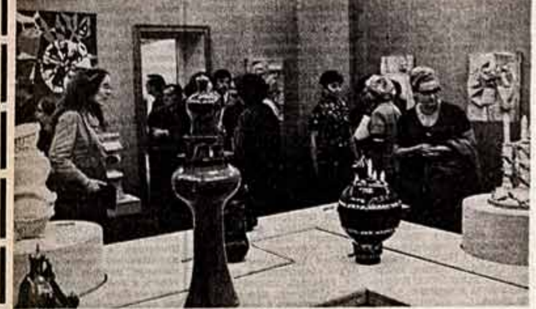
«Текстиль и керамика Венгрии» — так называется выставка, которая открылась в выставочном зале Союза художников СССР на Кузнецком, 50. Современные текстиль и керамика разлагаются в Венгрии на основе глубокого усвоения народных традиций...

Советские войны, штурмовавшие Будапешт в 1945 году, сберегли его ценнейшие памятники, в том числе и Музей изобразительного искусства, который фашисты заминировали. Новая Победа спасла художественное наследие многих народов Европы. И отблеск этой Победы — на полотнах великих мастеров. Сегодня их бережно хранят венгерские реставраторы и музейные работники.