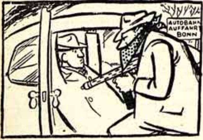
«Разбой? Да нет! Просто переговоры с позиции силы». (Из газеты «Дейне фолькс-шпигель», Западной Германии).