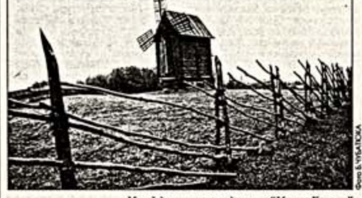
Музей деревянного зодчества "Малые Корелы"

Без бюджетных средств памятники Архангельска не сберечь