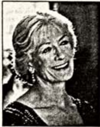
Сверху: Ванесса Редгрейв в фильме "Миссис Дэллоуэй". Справа: Наташа Ричардсон в спектакле "Кабаре"