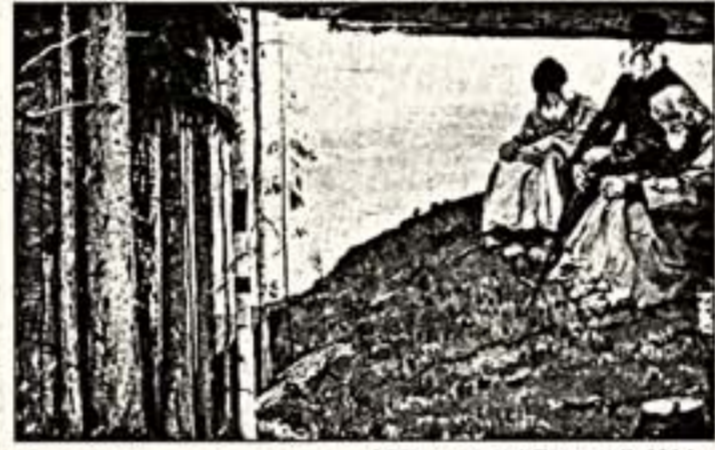
М.Нестеров. "Лисичка". 1914 г.