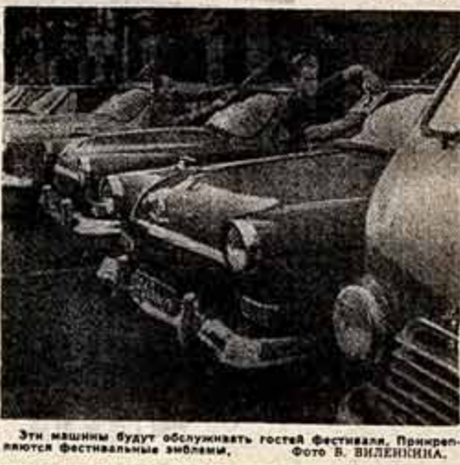
Эти машины будут обслуживать гостей Фестиваля. Прикреплено Фото В. ВИЛЕННИНА.