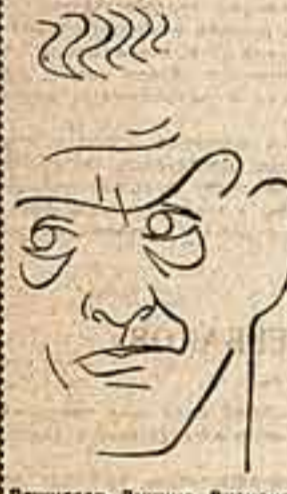
Ренисав Дунино Висконти (Италия)