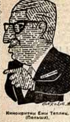
Ренисав Эини Телма (Польша)