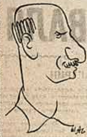
Ренисав Сергей Герасимов (СССР)