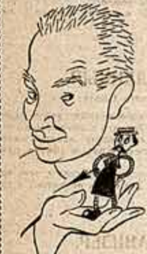
Ренисав Карол Земан (Чехословакия)