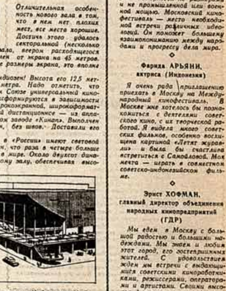
Кинотеатр «Россия» Институт «Маспронт». Магистральная мастерская № 8 в здании № 8. Митосского. Автор проекта — архитекторы Ю. Шеварделов, Д. Солонин, Э. Голдманский. Рисунки архитектора К. ШЕХОДИ.

Кроме большого зрительного зала, есть еще два очень уютных зала, вместимостью около 200 человек каждый. Оба они расположены на уровне нижнего фойе и предназначены для демонстрации кинохроники: правый имеет широкий экран, левый — обычный.