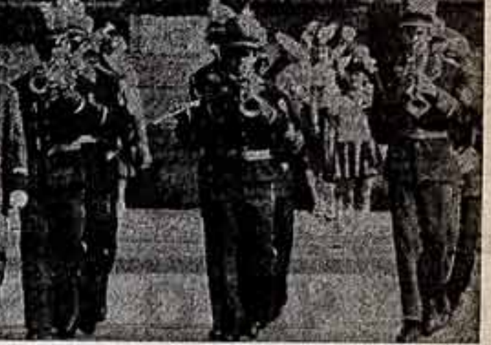
На параде духовых оркестров в Целинограде, посвященном 40-летию Великой Победы, коллектив Дворца культуры целинских призывал лучшим.

Коллектив Государственного академического Большого театра оперы и балета имени Навои решил совместно с районом Ташкента проводить ежемесячно под девизом «Союз искусства и труда». В их программу включены театральные спектакли, концерты, лекции, уроки музыки и танца, вечера для труженников предприятий, учреждений и учебных заведений на оперные и балетные спектакли, творческие встречи, артистические конференции.