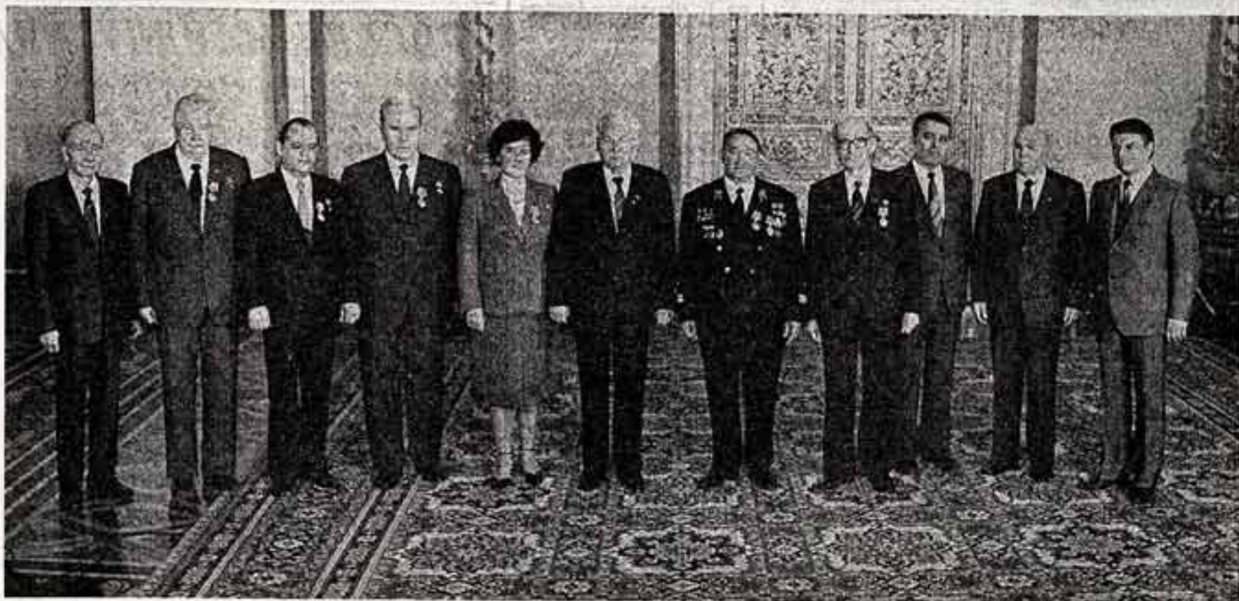
Во время вручения наград.

Постановление Центрального Комитета КПСС «О дальнейшем улучшении деятельности районных и городских газет» является еще одним ярким проявлением партийной заботы о развитии и укреплении местной печати. Долг горкомов и райкомов партии, редакционных коллективов заботу партии ответить дальнейшим повышением роли и значимости районных и городских газет в коммунистическом воспитании трудящихся, мобилизации их на успешное осуществление экономической и социальной политики КПСС.