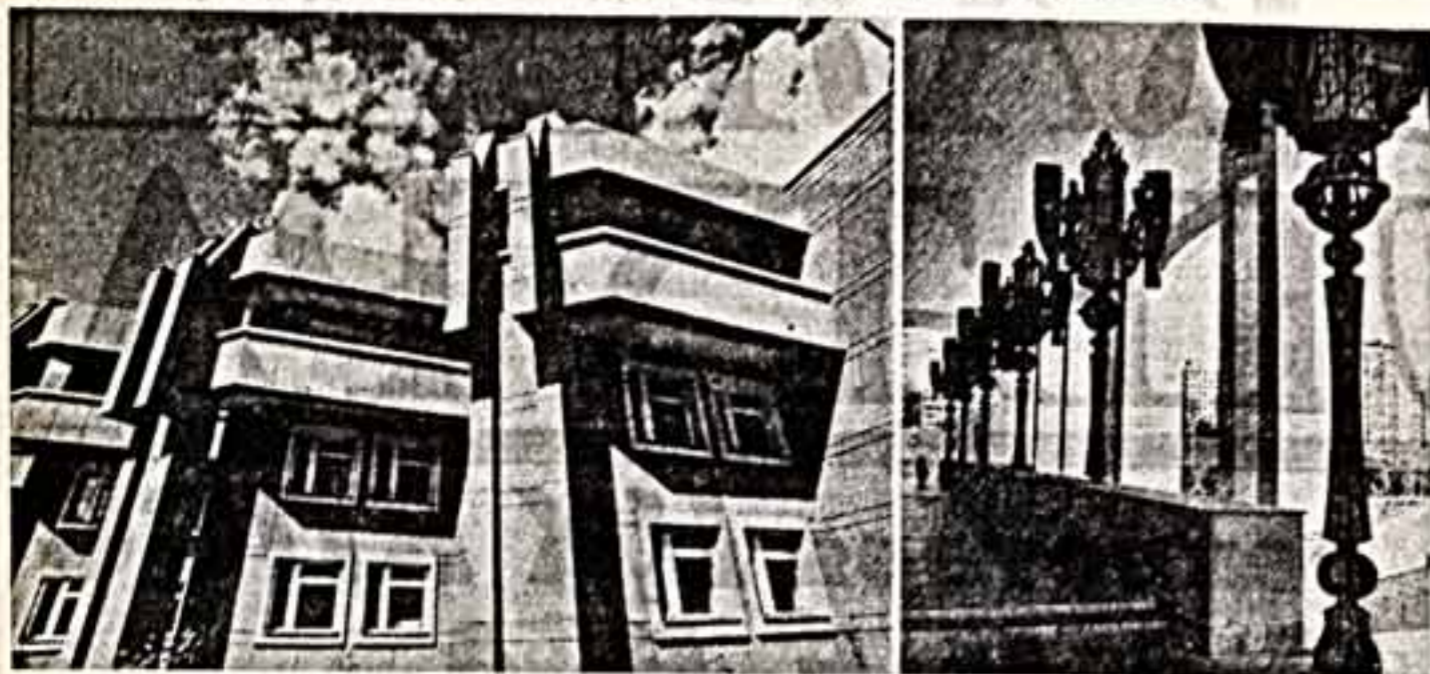
Так выглядит городской дворец пионеров и т.д.