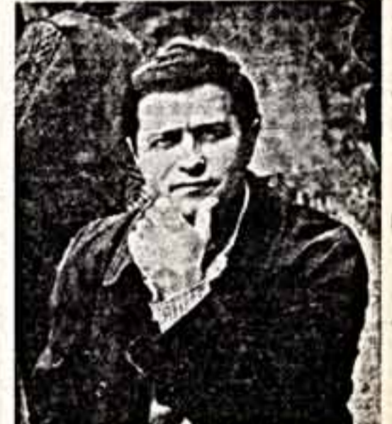
во мне своего режиссера. А может, на самом деле в тех уж полудает, как мне самому кажется, и только другие люди знают, хорошо ли им со мной работать?

— Ни в коем случае. Так уж получается, что актеры делают то, что я хочу. Возможно, это происходит потому, что работаешь с единомышленниками, возможно, потому, что они видят