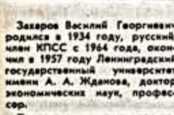
Захаров Василий Георгиевич

Президиум Верховного Совета СССР назначил тов. Захарова Василия Георгиевича министром культуры СССР.