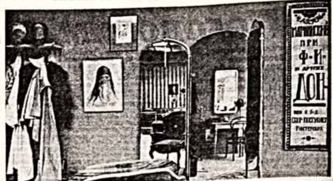
1917 года, показать которые в резервном зале позволили лишь пространственные объемы Манежа...