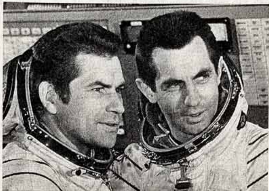
Герои Советского Союза, летчики-космонавты СССР Коваленко Владимир Васильевич и Иванченко Александр Сергеевич.

Под знаменем марксизма-ленинизма, под руководством Коммунистической партии — вперед, к новым победам в строительстве коммунизма!