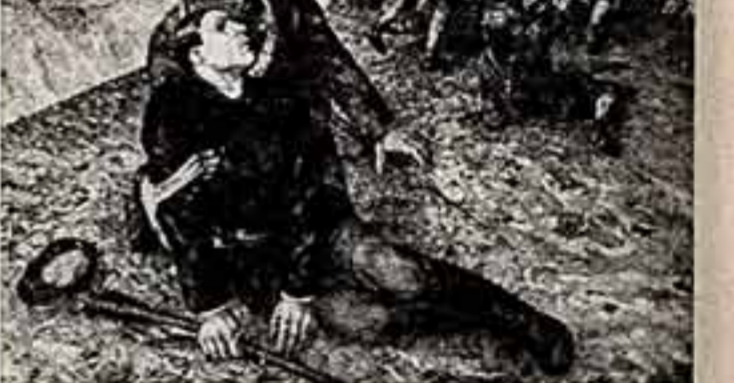
Л. АРНШТАМ, народный артист РСФСР.

Наторморт — еще одна существенная грань творчества К. С. Петрова-Водкина. Богатство композиционных приемов, динамика, неожиданные точки зрения, сложные ракурсы, декоративность и символическая значимость форм и цвета дают художнику возможность в изображении воз-