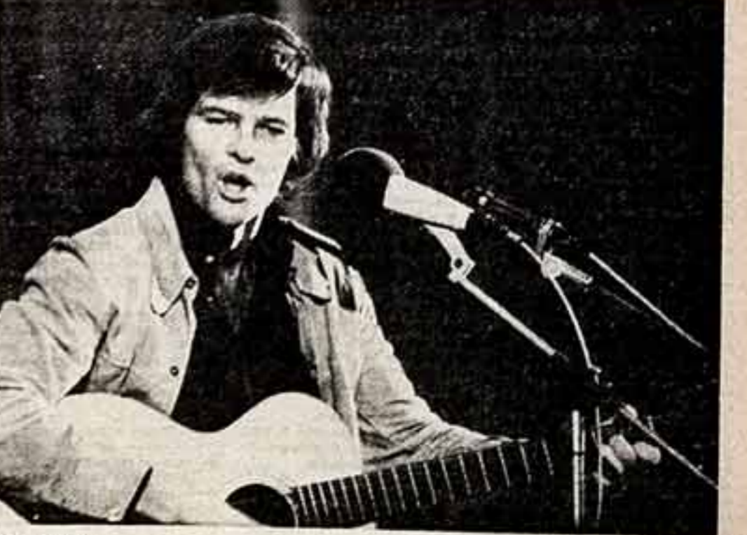
Дин Рид.