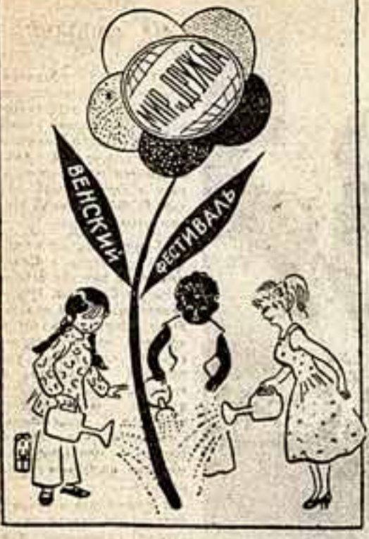
Рисунок из китайской газеты «Чунго циньнян».

дународный концерт «По всему миру», в котором приняли участие ансамбли и солисты Болгарии, Китая, Великобритании, стран Африки, Советского Союза, США и многих других стран. В первые же дни фестивали в лучших залах Вены — Музикферайн, Колпачгаузе, Ронах-театре и т. д. делегация многих стран показала свои торжественные галла-концерты (национальные программы). Нам удалось побывать на некоторых концертах, и нужно сказать, что они произвели очень сильное впечатление. Исклительный успех выпал на долю художественной группы советской делегации. В газете «Советская культура» уже сообщалось о том, как прошел торжественный концерт советской делегации 27 июля. Триумф сопровождал наших артистов и во всех их последующих выступлениях. Успех, например, ленинградского балета таков, что потребовались парадные полчища, чтобы парадом по улицам, окруженным огромной толпой любителей советского искусства. Конечно, все билеты на выступления советских артистов уже давно проданы. И сейчас с приближением последнего торжественного концерта делегации из Штатгалле — крупнейшим закрытым концертным залом Вены, вмещающим почти 15 тысяч зрителей, кажется, что единственная цель, которой озабочены венские и делегаты фестивала, — это достать билет на последний советский концерт. Венцы и участники Праздника искусства, а также многочисленные гости австрийской столицы с большим