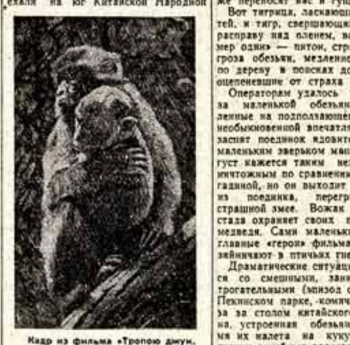
Кадр из фильма «Тропую джунглей».

БУДЕТЕ в Китае, обязательно поглядите Згуряка, поинтересуйтесь, как у него идут дела, — так же поручение переадресовано в Пекин на Вукозском аэродроме. «Но увидать режиссера так и не удалось». От Пекина экспедиция фильма «Тропую джунглей» находилась на расстоянии около трех с половиной тысяч километров. Когда мы приехали на юг Китайской Народной