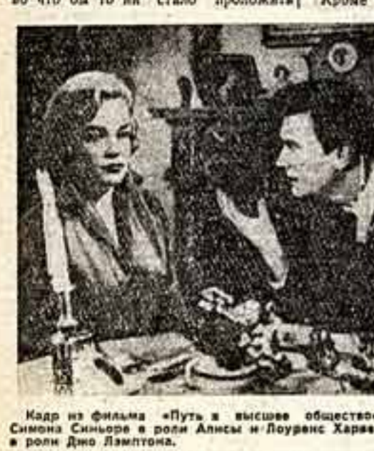
Кадр из фильма «Путь в высшее общество». Симона Синьоре в роли Алисы и Лоуренс Харрей в роли Джо Лэмpton.

Перед нами — герои английского фильма «Путь в высшее общество», поставленного режиссером Джексом Клейтоном по сценарию Нейла Патерсона. История молодого человека, не имеющего ни состояния, ни положения и решающего во что бы то ни стало проложить