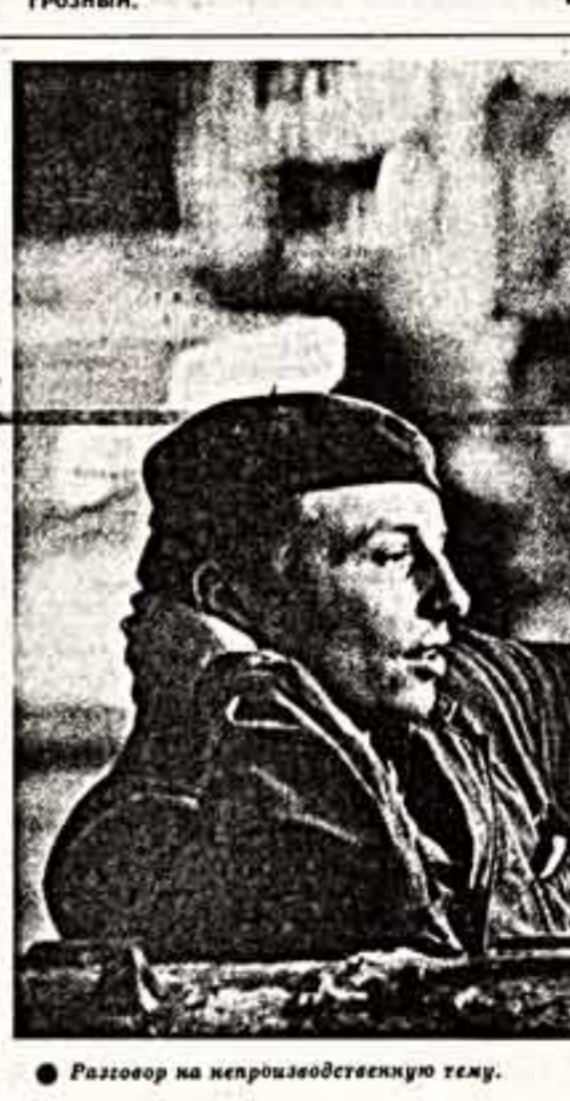
Разговор на непроизводительную тему.