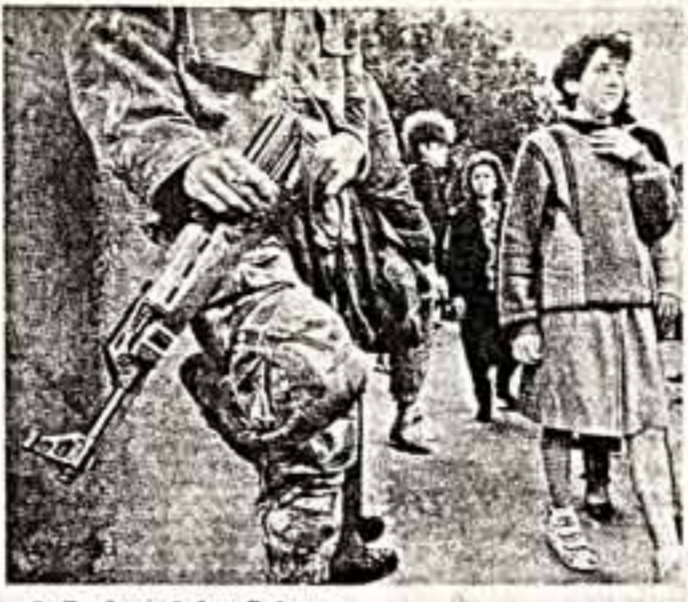
Трудные будни Беурта...

НАМ СООБЩИЛИ, ЧТО В ЭКСПОРТНОМ СЕКТОРЕ ИЗДАТЕЛЬСТВА ЦИИ СПС С. 1988 Г. ГАЗЕТА «СОВЕТСКАЯ КУЛЬТУРА» ИМЕЕТ ЗА РУБЕЖОМ 5340 ПОДПИСЧИКОВ. В ТОМ ЧИСЛЕ В ИРБ НАШЕ ИЗДАНИЕ ПОЛУЧАЮТ 1.527 ЧИТАТЕЛЕЙ, А В ЧССР — 646.