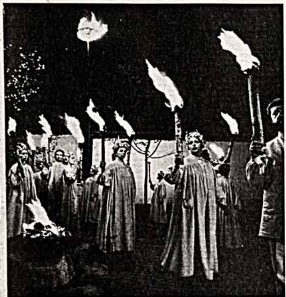
Возвратиться к истокам литовского народного творчества, воспринять старинные и незаслуженно забытые традиции — такую цель поставил перед собой фольклорный театр Музея народного быта Литовской ССР в Румушищисе.

Популярный в республике коллектив создавал интуитивно и спонтанно фольклорное искусство для заслуженных деятелей искусств Литовской ССР, лауреатов Государственной премии республиканской Повилас и Даляс Матяйтис. Авторы в труппу привлекаются по жанрам. Они играют на разных музыкальных инструментах, поют, танцуют, владеют навыками сценического поведения. В основу многих спонтанно созданных