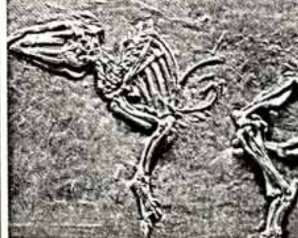
Фото из журнала «Гульн таг» (ФРГ). (По сообщениям корреспондентов «СК» и ТАСС).

Перед вами знаменитая первобытная лошадь, возраст которой около 60 миллионов лет. Как же «дошла» она до наших дней из праисторической бездонной глубины веков, став гордостью экспозиции Французского музея имени Заннигерри? Эту омажность в числе других обнаружили в карьере Мессельса, под Дармштадтом, где долгие годы открытым способом велись добыча горючих сланцев. Но начиная с 1973 года ученые-исследователи института музея ведут здесь плановые работы. В отложениях сланца, слагавшего некогда дно находившегося здесь изувольненной сохранилась, обильная флора фауны мезозойского периода. Альпы, например, и тому яркими еще даже не споминались.