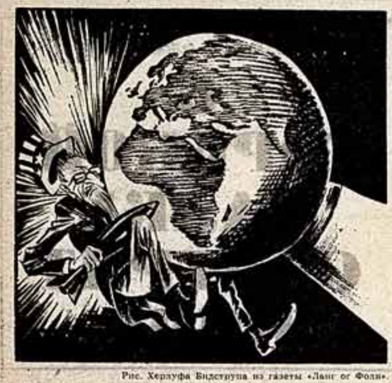
Рис. Херлуфа Видстрюпа из газеты «Ланг оф Фолд».