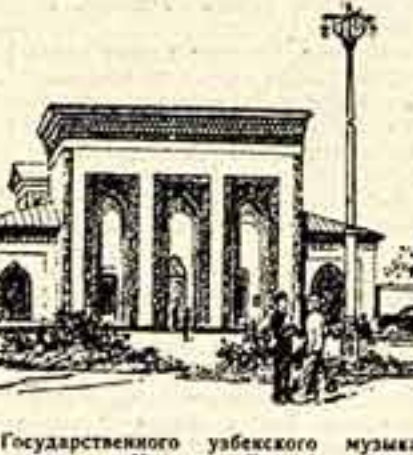
Новое здание Государственного узбекского музыкально-драматического театра имени Мухомина в Ташкенте. Строительство закончено в 1953 году.

Там, где простиралась пустыня, сегодня прокладываются улицы с благоустроенными зданиями. Еще со-