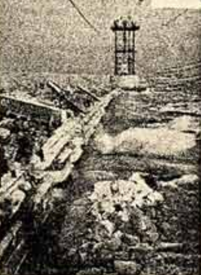
Перекрытие русла Волги и наплавной моста в районе строительства Куйбышевской ГЭС.

УЖЕ не бунтует Волга у Жигулей. Широкая гряда из бетона и камня удерживает последнюю протоку. Ближе к вечеру, когда крутилась в мире гидроэлектростанция, даст первый промышленный ток.