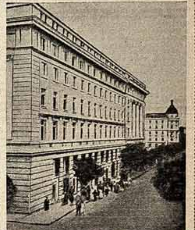
Новое пятиэтажное здание Высшего института театрального искусства имени Крыштофа Серафима — одна из достопримечательностей Софии. Здесь учатся 264 будущих актера, режиссера, театральных работников, музыкантов, танцовщиц, балетмейстеров, артистов балета, оперных певцов, артистов балет-балетмейстеров, артистов балет-балетмейстеров, артистов балет-балетмейстеров.

стране осуществлено обязательное начальное образование. В румынских селах работает более 13.700 домов культуры, шко-библиотек и красных уголков, свыше 12 тысяч библиотек. Около тысячи сельских домов культуры располагают стационарными киноаппаратами, остальные села оборудованы кинопередвижками. Свыше 400 тысяч трудящихся принимают участие в различных коллективных творческих самодеятельностях. Сегодня мы публикуем материалы, рассказывающие о расцвете культуры в странах народной демократии.