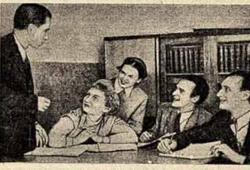
Большое внимание уделяет молодежи Польское радио. Специальные передачи для юношества — «Радиостанция молодежи», дискуссии о волонтерской молодежи, вопросы труда, быта и морали, воскресная передача «5:0 в пользу юности» и многие другие отвечают на запросы юношей и девушек города и села. В некоторых городах созданы радиоклубы для молодежи. Один из лучших — клуб в городе Ополье. Руководство Союза польской молодежи отметило хорошую работу Опольского клуба специальным дипломом. На снимке: обсуждение новой программы в Опольском молодежном радиоклубе.

В области культуры, искусства Германская Демократическая Республика может похвастаться с любой другой прогрессивной страной. Символом ее культуры была для меня недавно открытая государственная опера. Новейшая, она стоит на улице Уинтер-ден-Линден. Роскошь для немцев счастьем стала коллективный достоянием всего народа. Не только в архитектуре оперы сохранены старые традиции — в оперном искусстве также обрели былые времена.