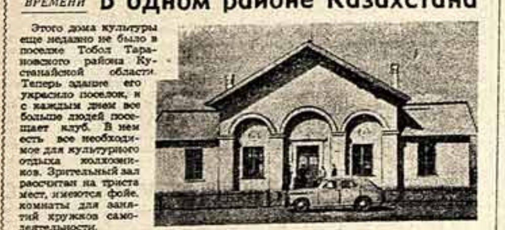
Новый дом культуры в поселке Тобол.

Этого дома культуры еще недавно не было в поселке Тобол Тарановского района Кустанайской области. Теперь здание его украсило поселок, и с января здесь все больше людей посещает клуб. В нем есть все необходимое для культурного отдыха молодежи. Зрительный зал рассчитан на триста мест, имеются фойе, комнаты для занятий кружков самодеятельности.