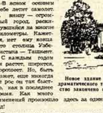
Новое здание Государственного узбекского музыкально-драматического театра имени Мухомина в Ташкенте. Строительство закончено в 1953 году.

В новом осеннем небе летит самолет. А внизу — огромный город, раскинувшийся на многие километры. Кажется, нет ему конца. Это столица Узбекистана — Ташкент.