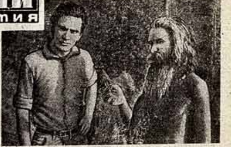
Стоять в Индии человек, религиозные или какие-либо иные убеждения которого могли толкнуть его на подобный шаг...

— Как пришла вам эта мысль? — спросил режиссера корреспондент мильского журнала «Виле нуове».