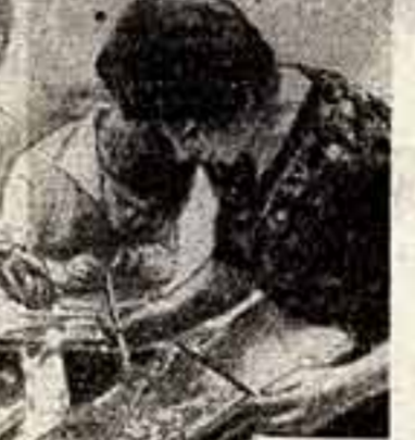
ПРОШЛО двадцать дней, как известный греческий композитор Мише Теодорисе на свободе...