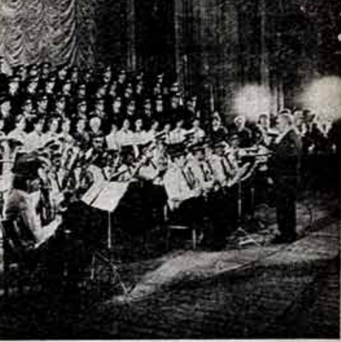
Участники областного смотря предрейтинга на суд зрителей областного филармонического ансамбля — хор, оркестры, ансамбли, группы, союзы...