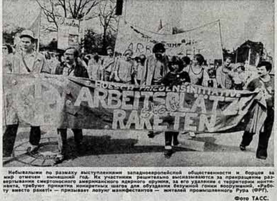
Небывалый по размаху выступлениями западноевропейской общественности и борцов за мир отмечен нынешний год. Их участники решительно высказываются за прекращение разрыва жизни смертоносного американского ядерного оружия, за его удаление с территории континента, требуют принятия конкретных шагов для будования безумной гонки вооружений, «работу вместо ракет» — призывает лозунг манифестантов — жителей промышленного Рура (ФРГ).

Фестиваль обещает богаты музыкальные впечатления. И. КОНДРАТОВИЧ, спец. корр. «Советской культуры», МОСКВА.