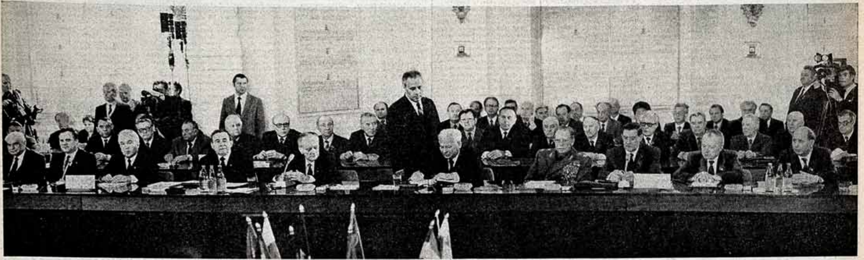
Документы Экономического совещания подписывает за Союз Советских Социалистических Республик Генеральный секретарь ЦК КПСС, Председатель Президиума Верховного Совета СССР К. У. Черненко.