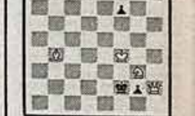
Мат в 2 хода.