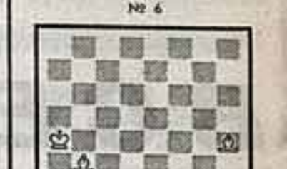
«Б» № 6