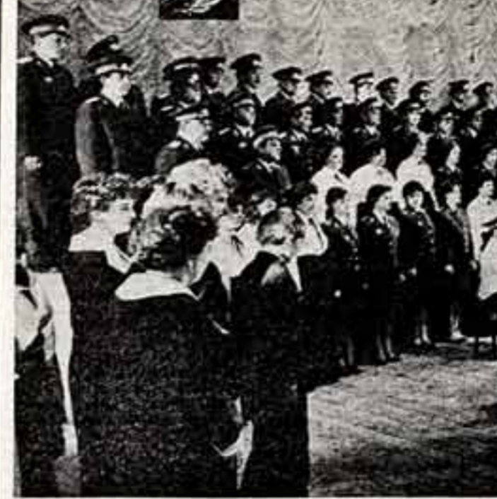
С большим успехом прошла творческий отчет ежегодной коллегии творческих работников культуры — кино, оркестры, ансамбли, группы, союзы...

Взаимосвязь и взаимообусловленность кино и идеологии, кино и политики, идеологии и политики — это не только актуальный вопрос, но и вечный вопрос искусства и культуры.