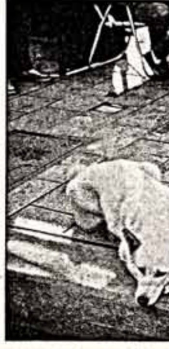
Город-курорт Юрмала, принимающий в позапрошлом году участников встречи советской и американской обществ, ныне приглашает еще на один визит. Фото: журналист А.П. Козловский. Фото: журналист А.П. Козловский. Фото: журналист А.П. Козловский.