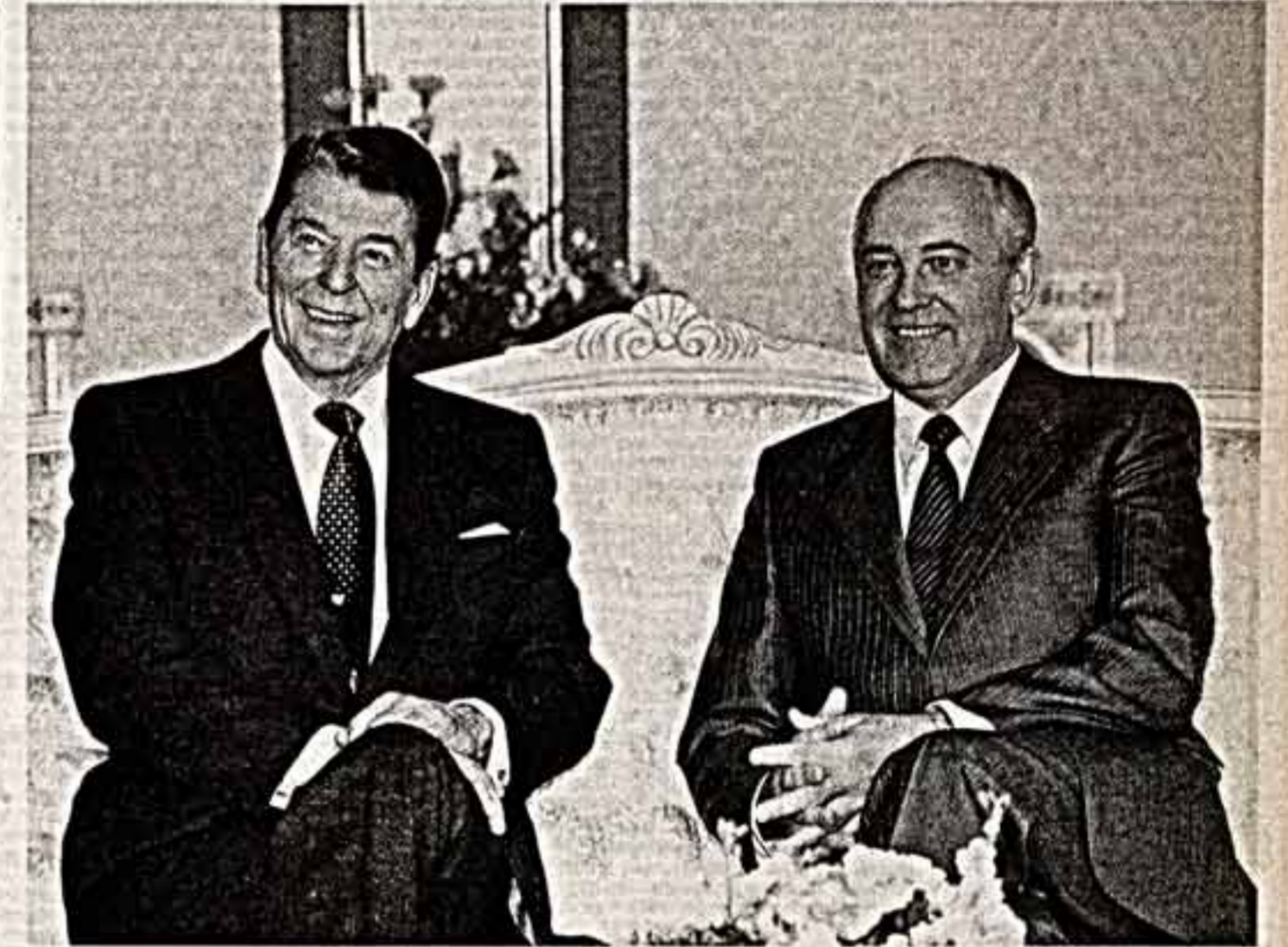
Во время беседы.

У знамени Вооруженных Сил СССР начальники почет-