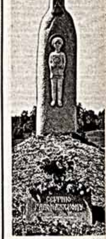
Памятный знак Сергию Радонежскому.

В селе Гордон Загорского района Московской области состоялось торжественное открытие памятного знака Сергию Радонежскому. На митинге выступили известные литераторы и художники, представители Всероссийского общества охраны памятников истории и культуры, а также автор памятного знака — известный советский скульптор, лауреат Государственной премии СССР В. Клыков.