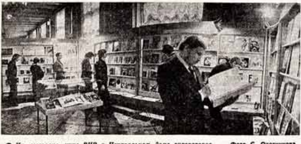
На выставке книг ВНР в Центральном доме литераторов.