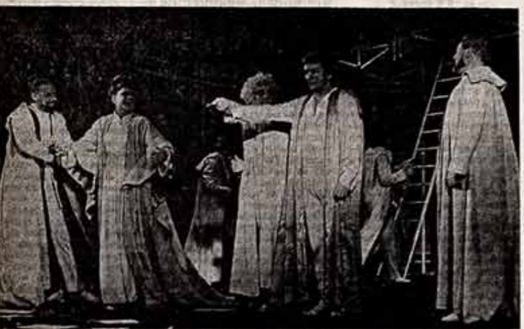
Сцена из спектакля «Все хорошо, что хорошо кончается».