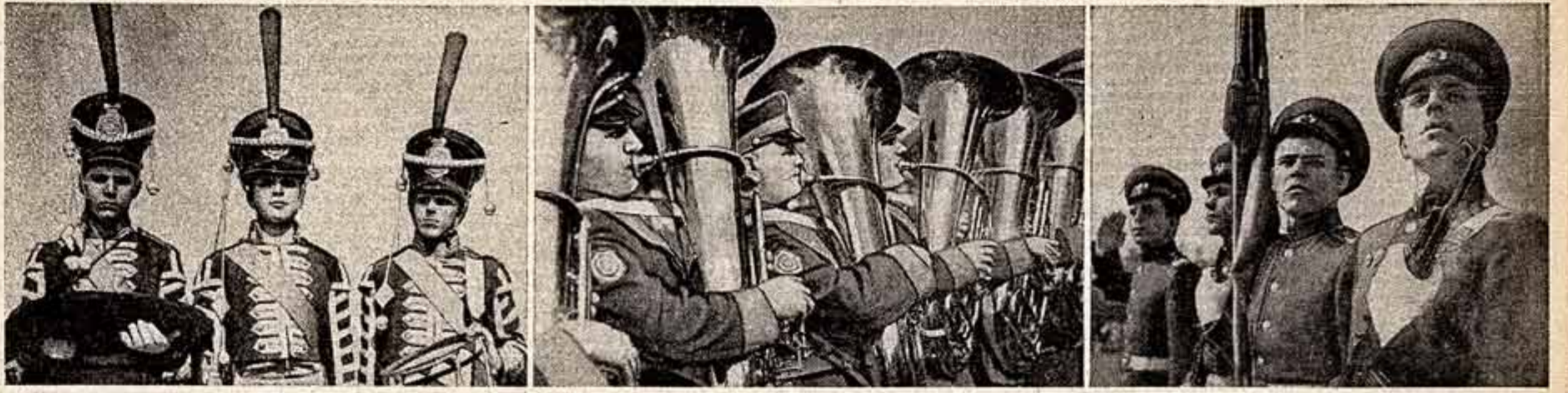
БОРОДИНСКОЕ ПОЛЕ.