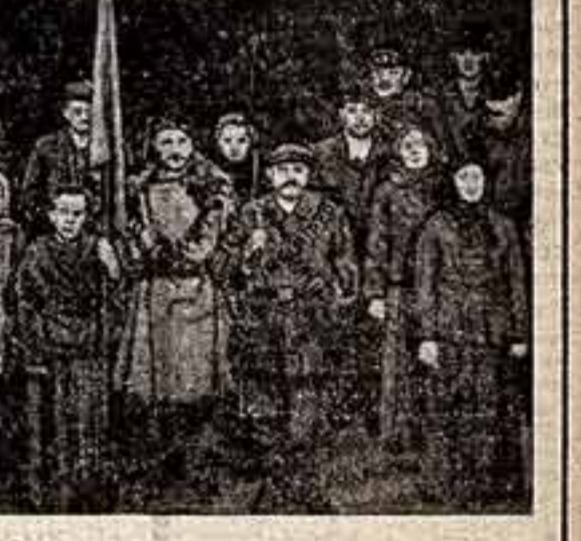
Финальная сцена спектакля.