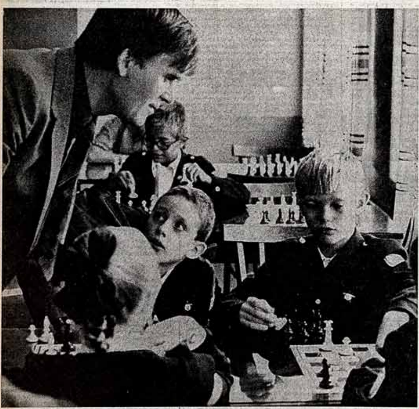
В расписании занятий общеобразовательной школы № 45 города Волгограда — уроки шахмат. По примеру этой школы шахматные уроки ввели и в ряде других школ города.