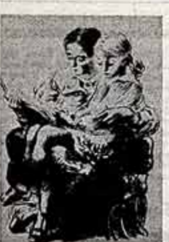
Нас всегда восхищают люди, сумевшие не просто дожить до преклонных лет...