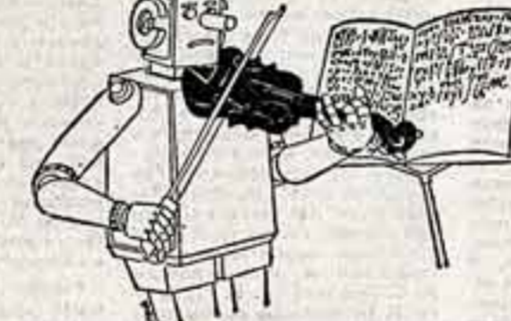
Карикатура Любомира Котрич из чехословацкой газеты «Правда».