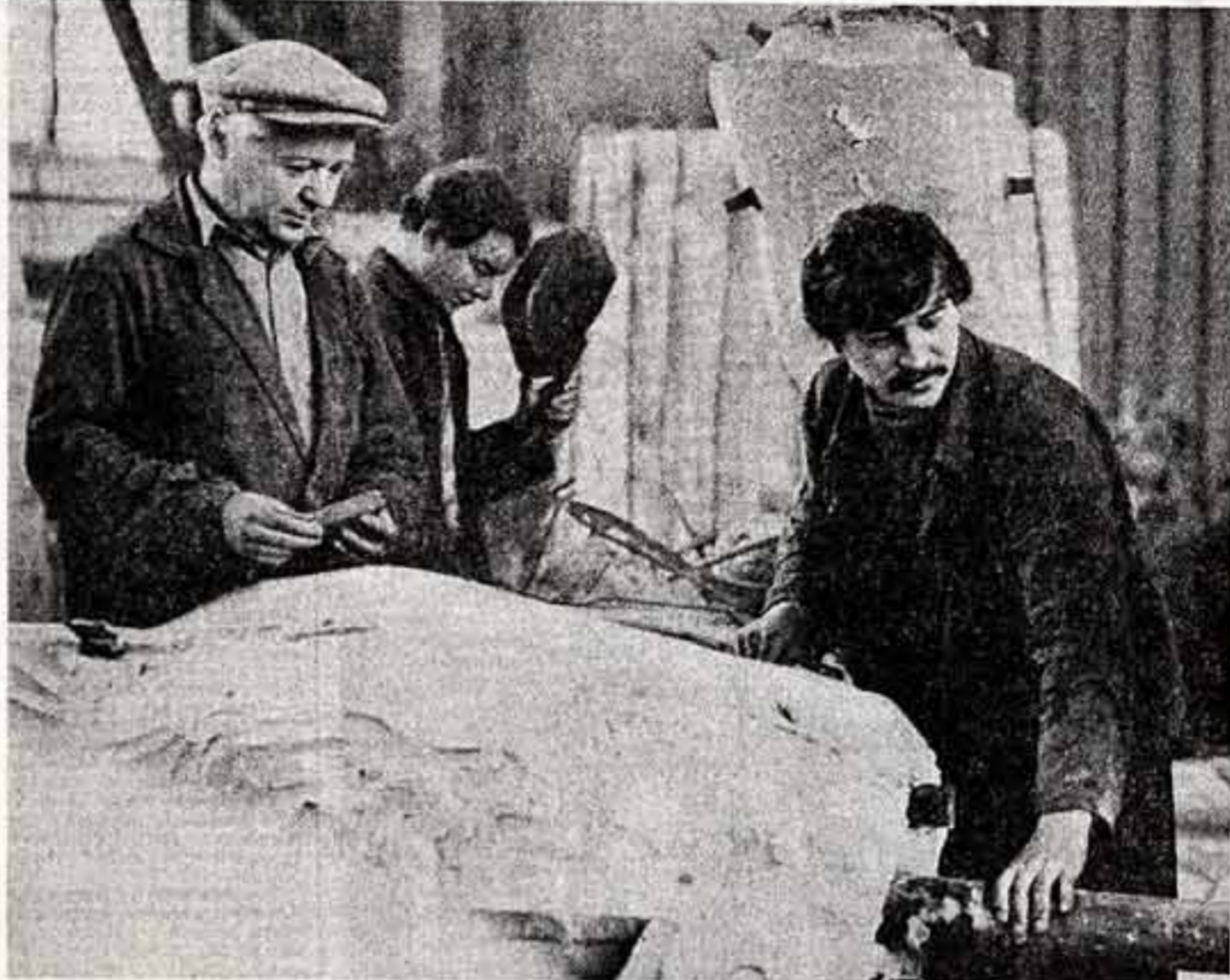
Мытищинский экспериментальный завод художественного литья имени Е. Ф. Белашовой — предприятие уникальное. Почти все известные лаятники и скульптурные комплексы обрали свою жизнь в его цехах.