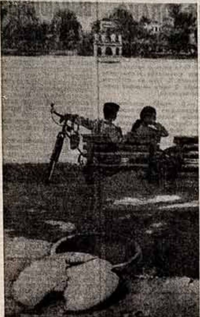
Халоп, февраль 1973 года. На берегу озера Везера...