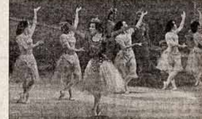
Сцена из балета «Сын земли».