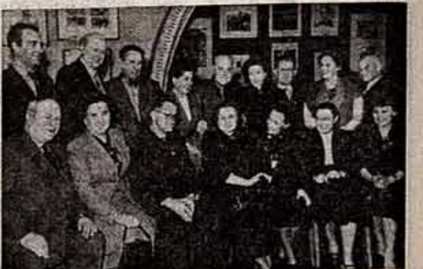
● Май 1955 года. Встреча с Вероловом Брехтом и Еленой Вайгель в ЦДРИ.

Однако при всей теоретической путанице руководителем и вдохновителем молодого театра был, несомненно, одаренным, интерес-