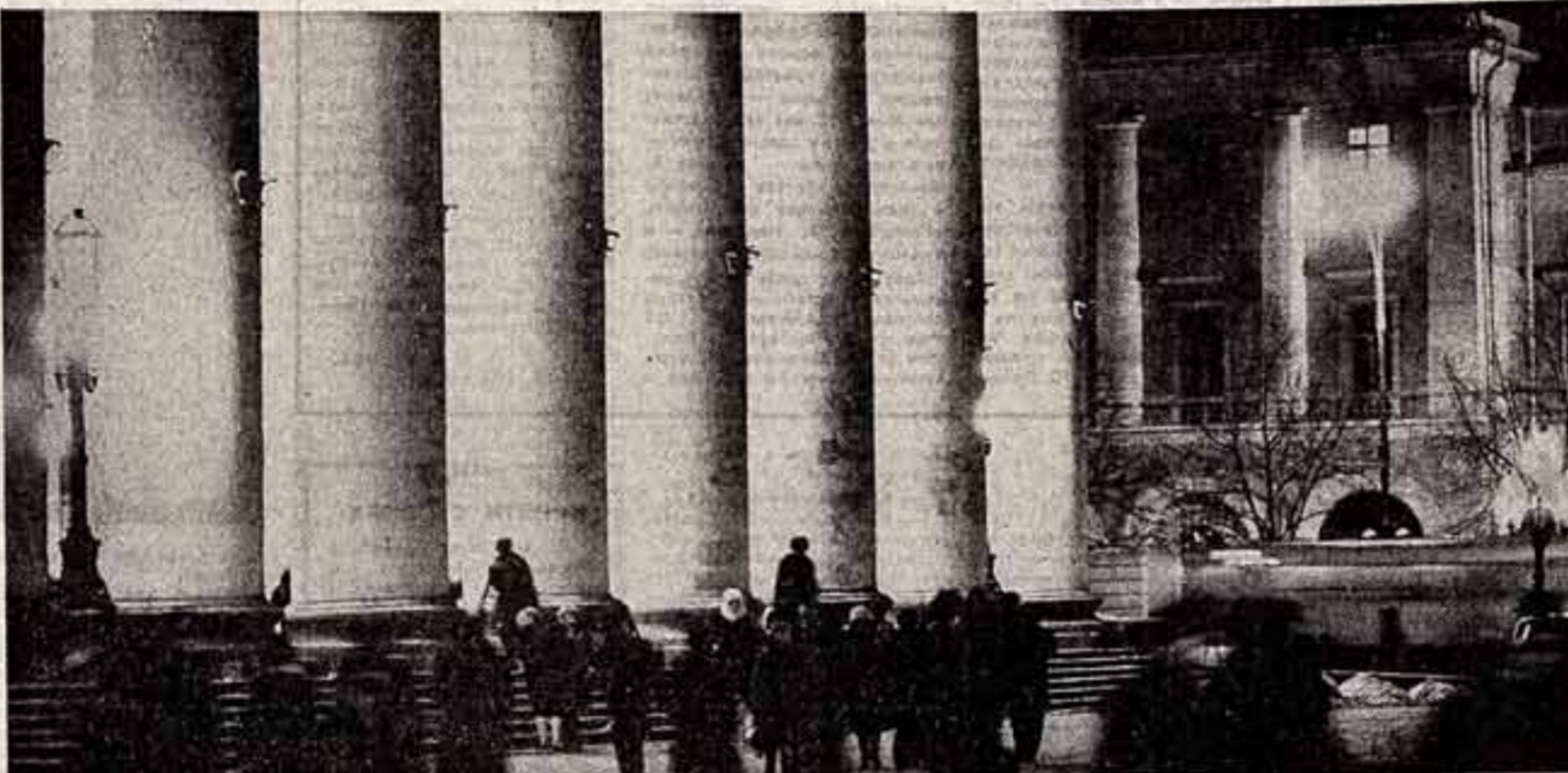
Третье отделение охватывает нас, когда мы подходим к подъезду театра. За ним — волшебный мир искусства...

Ф. В. Лопухов был истинным патриотом. В первые годы после революции он отверг все предложения зарубежных импресарио, заявив, что «хочу участвовать в строительстве нового общества» и «хочу участвовать в строительстве нового общества». Смелый экспериментатор, он словно ошествила живую связь людей. И в то же время трудно назвать художника, который бы так бережно относился к классическому наследию: его усилиями в театре был сохранен золотой фонд русского балетного искусства. Федор Васильевич принимал активное участие в создании нового, советского репертуара. Широко известны его постановки — балеты «Пушкинелла», «Ледяная дева», «Ночь перед Рождеством», «Тарас Бульба», «Весенняя сказка», «Валлада о любви», «Картинки с выставки». Будучи художественным руководителем балетных групп Ленинградского академического театра оперы и балета имени С. М. Кировой и Ленинградского академического Малого театра оперы и балета, он сделал многое для сохранения и обогащения русской классической балетной исполнительской школы, внес значительный вклад и в развитие молодого хореографического искусства братских союзных республик.